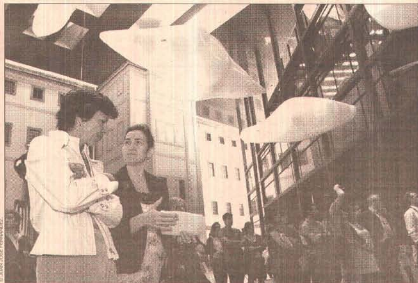
Soledad López, presidenta de la SECC, y Ángeles González-Sinde, ministra de Cultura, durante la presentación del programa de actividades del Año Xacobeo 2010.