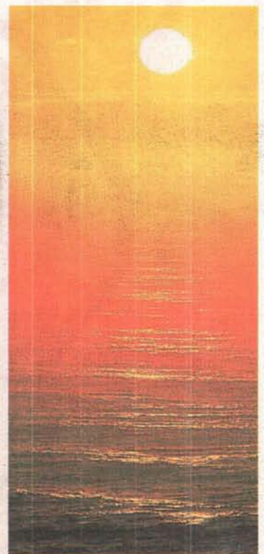
El mar es la referencia de estas villas

■ Vicar , situado en el corazón del poniente, es un pequeño universo de contrastes, donde lo antiguo y lo moderno, la tradición y la innovación conviven en armonía. Al mismo tiempo, ofrece al visitante enclaves de ensueño y una excelente gastronomía para disfrutar de la buena mesa.