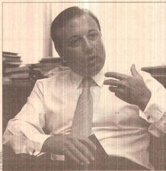
Joan Mesquida, secretario de Estado de Turismo, ha suscrito un acuerdo con la Fundación Thyssen-Bornemisza para la promoción del museo dentro del Plan de Turismo Horizonte 2020.