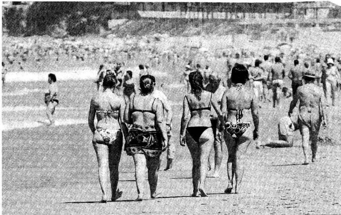
Vista de la playa de La Barrosa donde se ha depositado 50.000 metros cúbicos de arena desde principios de mayo.