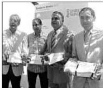
Los representantes de la Safor.