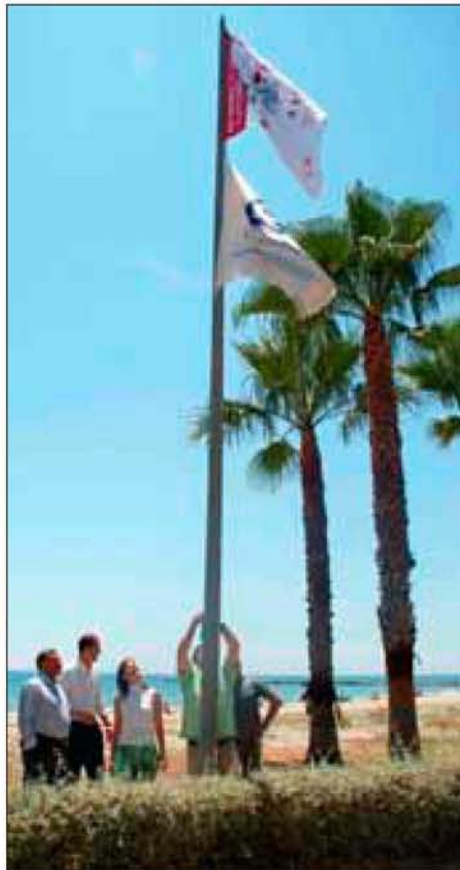
Momento del izado de las banderas, ayer. / EM

Entre las principales infracciones, este documento (que hasta ahora figura como provisional) contemplaba la de realizar necesidades fisiológicas en la vía pública, la colocación en la vía pública de macetas, jardineras, etc., subir