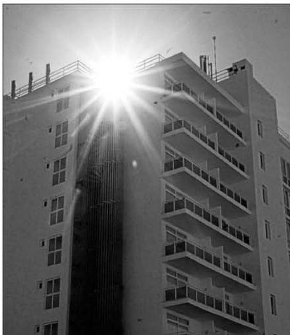
Hotel en Cala de Bou en una imagen de archivo