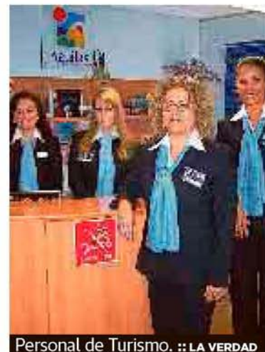
Personal de Turismo.