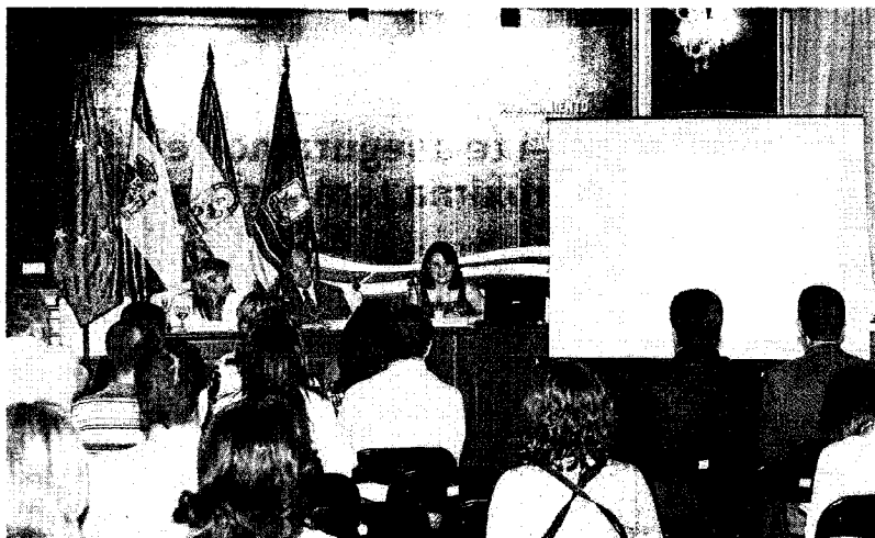
Un momento de la presentación del Plan en el Palacio Municipal de Sanlúcar.

Así las cosas, lo realmente novedoso de este segundo plan de Doñana se encuentra en actuación