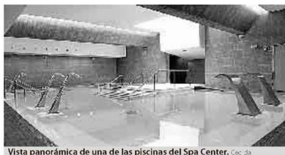
Vista panorámica de una de las piscinas del Spa Center.