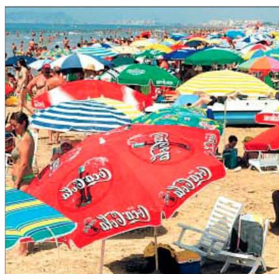
La playa de Gandia, ayer, abarrotada de turistas.