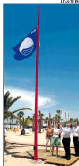
La bandera «Q» es signo de calidad.

Este año las playas de Burriana cuentan con atractivos añadidos, como una nueva zona de ocio y juegos de 1.000 m2 en la Playa de l'Arenal, con área de descanso y juegos infantiles. Además, también se ha incorporado una zona de juegos a la Playa de la Malva-rosa.