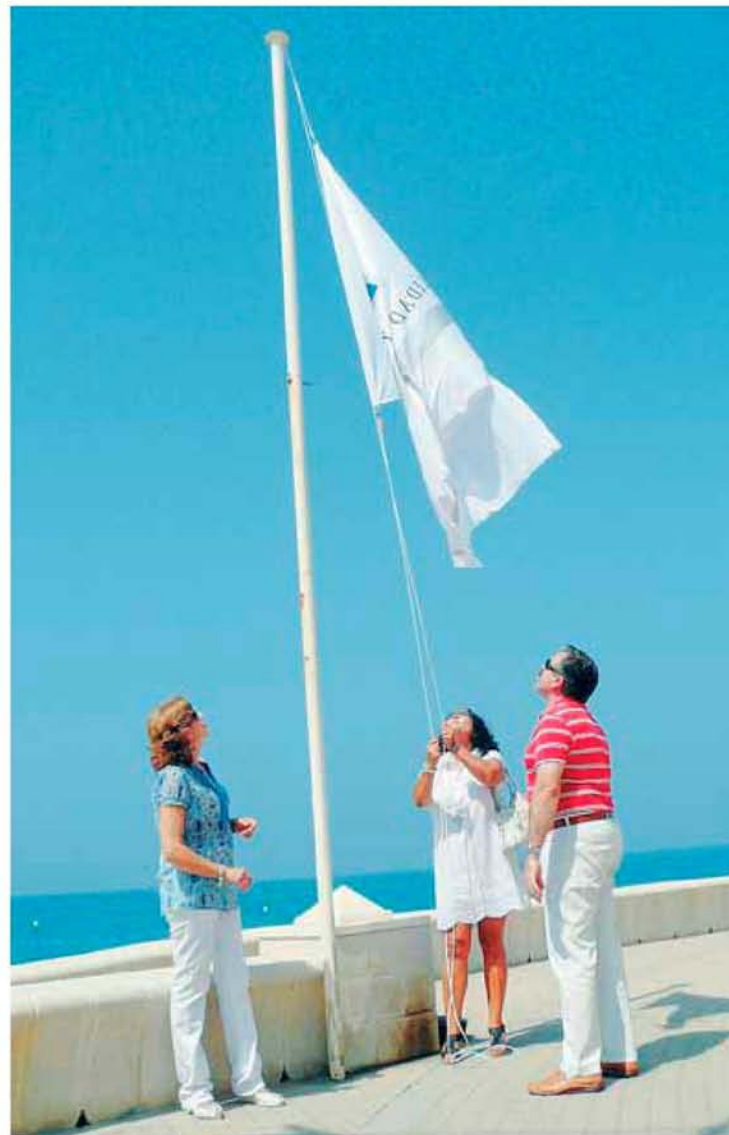
Momento del izado de la bandera de la Q de calidad. ■ A. F. V.

El Ayuntamiento aún no ha recibido justificación sobre la denegación de la bandera azul