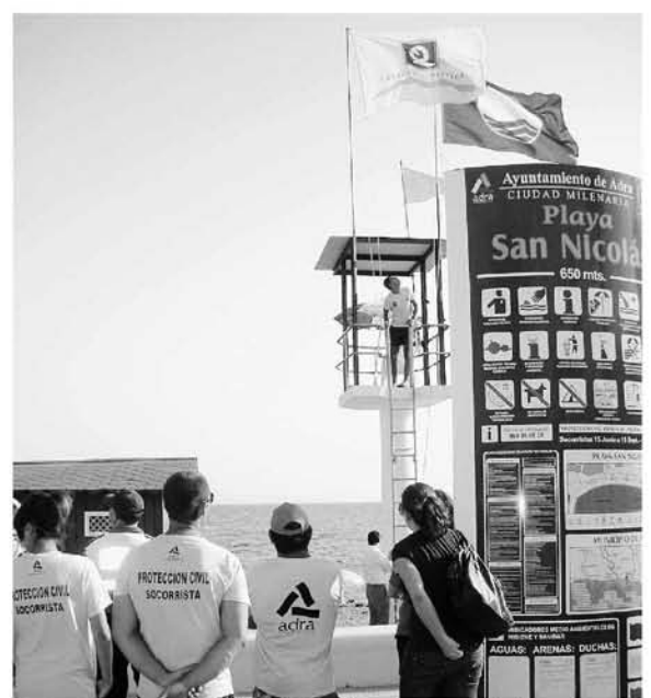
En San Nicolás se izaron las dos banderas por su calidad. de L. M.

gar, tuvo lugar el izado de la bandera azul y la de la Q de calidad conseguida por esta playa por su excelencia y buenos servicios, y que se unen a las conseguidas por El Censo. El siguiente objetivo es conseguir la bandera para la zona de Poniente y Linares adelantó que ya se ha hecho la auditoria en la playa de la Sirena loca. «Estamos muy contentos porque el auditor ha reconocido el trabajo que hemos hecho y nos ha dado la enhorabuena, esperamos que nos la concedan». Asimismo el edil de Playas explicó a la prensa que cuando se concedieron las banderas azules el Consistorio pidió una explicación ante la no consecución de un distintivo para esa misma playa «y nos han contestado que el trámite se hace en base a los análisis del año anterior, pero el año anterior la playa aún no estaba censada, por lo que no consta que existiera, así que habrá que esperar al año que viene, ya que este año sí está censada y habrá análisis de esa zona. De todas formas, la semana pasada tuvimos la inspección de la bandera azul y además de visitar las zonas a las que se han concedido este año invitamos a los inspectores a ver la playa de la Sirena