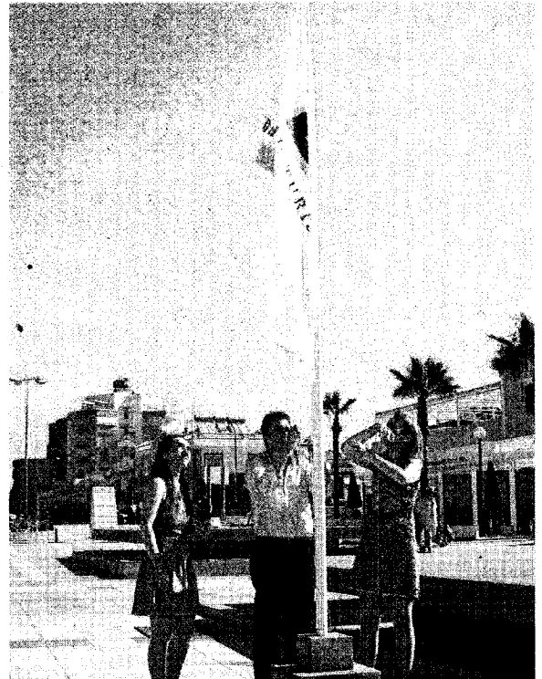
A la izquierda, playa de La Bota por la mañana, con El Portil al fondo. A la derecha, el alcalde de Lepe iza la bandera de calidad.