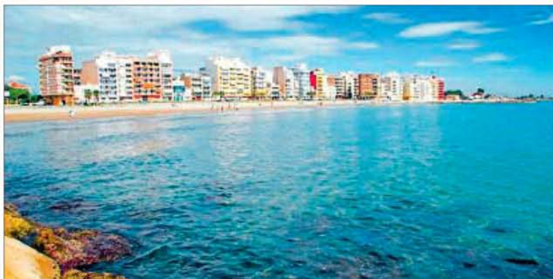
La playa del Grao de Burriana ha conseguido por primera vez la bandera «Q».

El alcalde, Francesc Colomer, destacó la importancia de estas distinciones, que se suman a las cinco banderas azules conseguidas por este municipio por segundo año consecutivo, y recordó que «Benicàssim sigue su apuesta por la calidad turística».