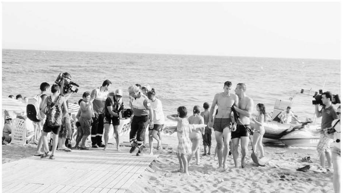
Protección Civil realizó un simulacro en la playa donde desplegó todos sus medios humanos y materiales.