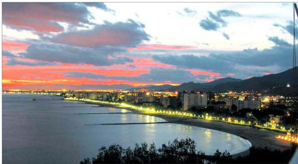
Benicàssim, al atardecer, con el perfil de las montañas del Desert de les Palmes.