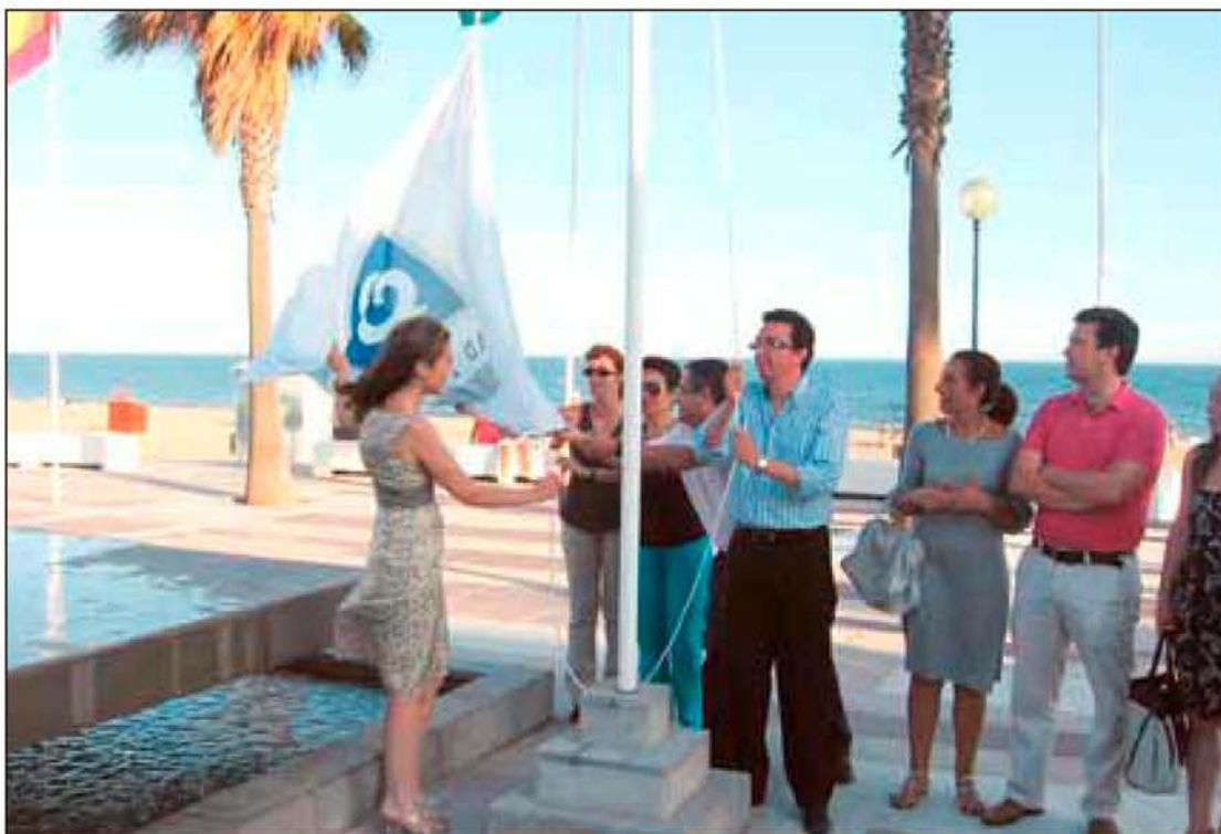
El alcalde de Lepe, el año pasado, procede al izado de la bandera que certifica la calidad turística de playa.

El Ayuntamiento recuerda que trabaja «de manera constante» por esta playa