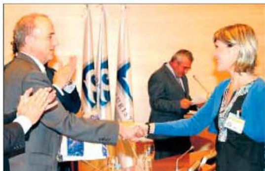
La teniente alcalde recibe los galardones, en Madrid.