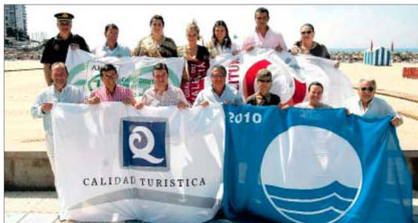
La calidad de las playas de la Comunitat Valenciana, de récord.

En el caso de Valencia, las playas de la provincia acumulan 25 galardones, seis más que el año pasado, lo que también supone un récord, a pesar de haber perdido dos banderas azules con respecto a 2009, ya que desde que comenzó la campaña como máximo las playas valencianas habían obtenido 23 banderas azules.