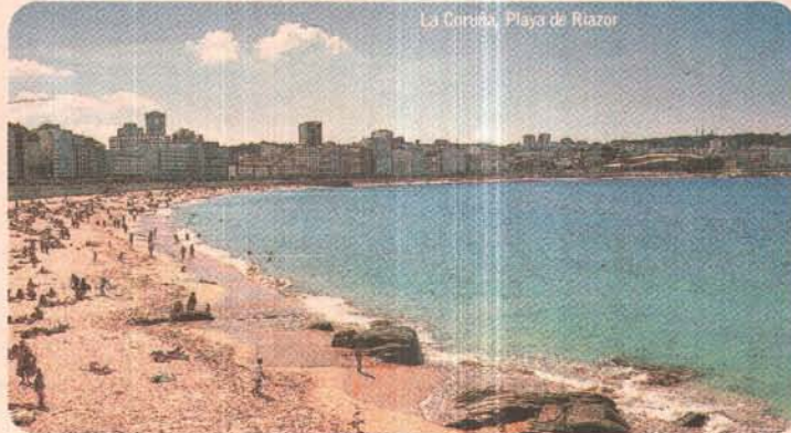
La Coruña. Playa de Riazor

Los romanos bautizaron con el nombre de Magnus Portus Artabrorum a los tres espacios naturales que conforman las rías de Ferrol, Ares y Betanzos, y A Coruña. Tierras en las que moraron los ártabros en la Galicia prerromana. Se trata de un litoral muy recortado, aunque con pocos precipicios, lleno de playas paradisíacas y con olas moderadas que atraen hasta arenales como el de Valdoviño a los aman-