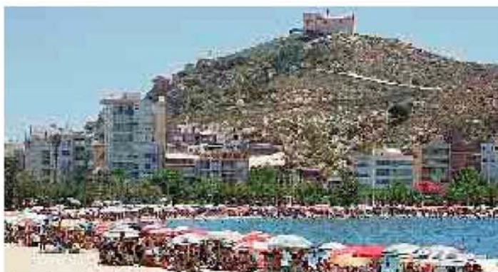
Las playas de Águilas ya lucen un aspecto veraniego. J. Ruiz Parra

El municipio cuenta este año con ocho banderas azules en sus playas