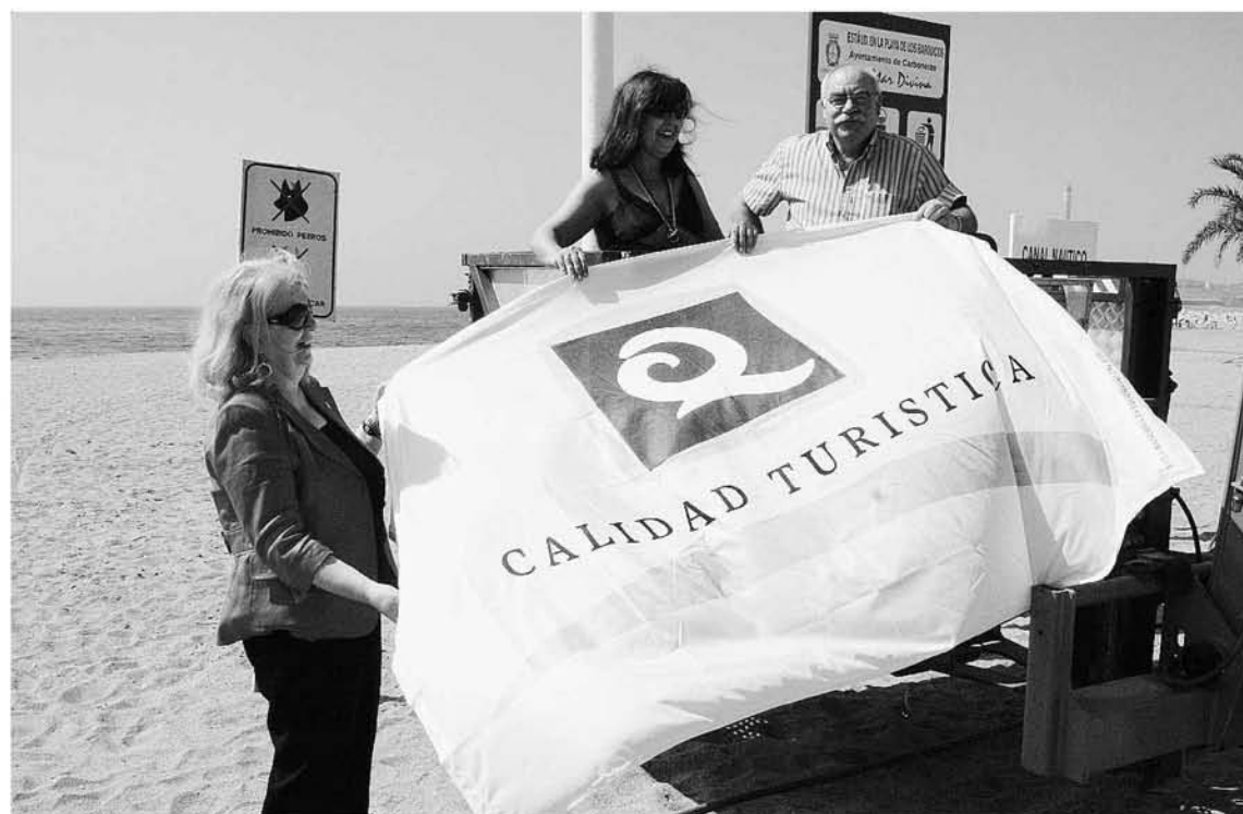
lizado de las banderas en las playas de Carboneras.

La playa Las Marinicas se encuentra entre el puerto industrial y el puerto pesquero de Carboneras con una longitud de 1.330 metros. Tiene una gran afluencia de usuarios, y al situarse entre dos infraestructuras portuarias, sus aguas son tranquilas. Tiene también fácil acceso tanto a pie como en coche y entre sus servicios destacan pasa-