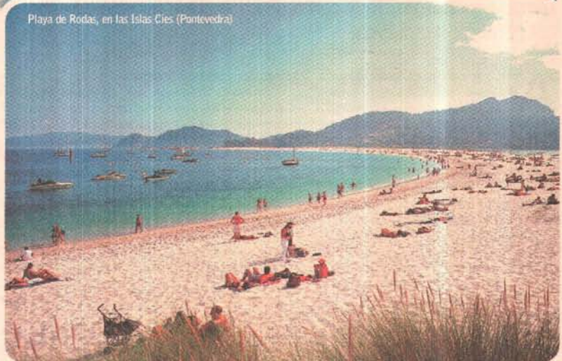
Playa de Rodas, en las Islas Cíes (Pontevedra)

cuentran en el municipio de O Grove, donde surge la emblemática playa A Lanzada, antes de llegar a la conocida playa de Silgar, en Sanxenxo. Cuanto más hacia el sur la temperatura de las aguas experimenta un ligero ascenso, apreciable en Xiorto y Cabeceira, en Poio, Portocelo, Agüete y Mogor, en Marín, y Portomaor, Área de Bon y Lagos, en Bueu.