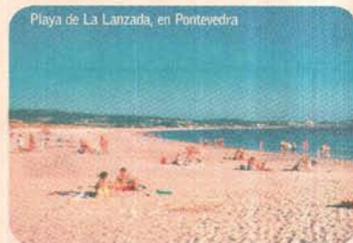
Playa de La Lanzada, en Pontevedra

Frades, Santa Marta y A Barbeira, si bien lo que hace que esta villa sea conocida a nivel nacional son, entre otras cosas, su parador, su puerto náutico y su importancia histórica, tras arribar en 1493 la nao Pinta después de su viaje a América. Finalmente, en A Guarda, y tras una visita al castro de Santa Negra, tiene lugar el último baño azul en las playas de O Muíño y Área Grande.