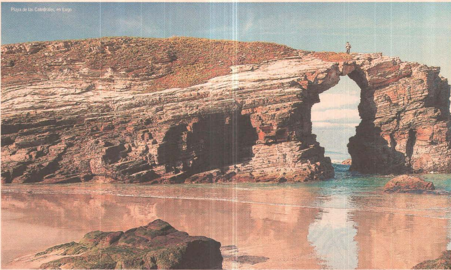
Playa de las Catedrales, en Lugo