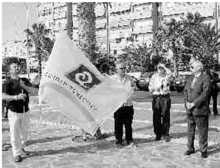
Las banderas lucen en el Paseo Marítimo, en los Cárabos. :: Á. J. M.

ficación ISO-9001, acredita una constante mejora de la calidad en las playas. De igual forma, la Q de calidad Turística la concede el Instituto de Calidad Turística Española y evalúa los servicios que afectan al usuario, es decir, la seguridad, la limpieza, la recogida de residuos o el equipamiento. Imbroda cree que el esfuerzo económico realizado este año en materia de pla-