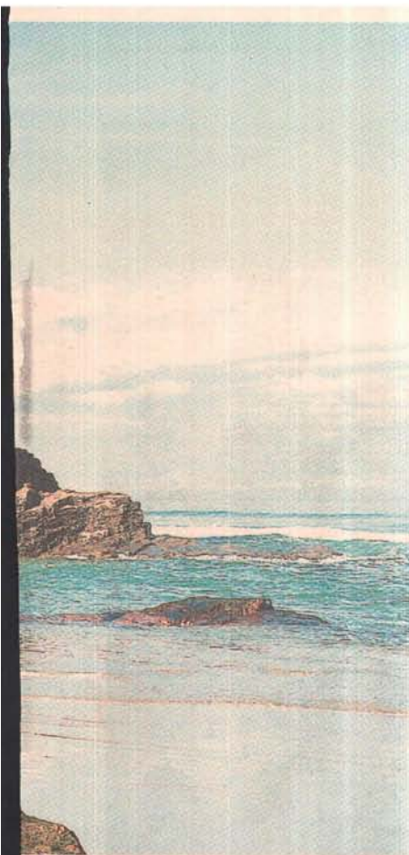
Playa Los Castros, en Lugo