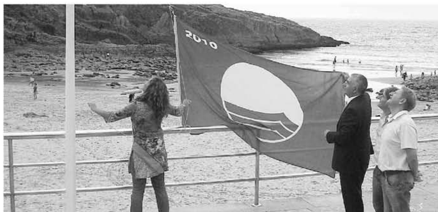
La alcaldesa de Llanes iza la bandera azul de El Sablón en presencia de Vega, Balmori y Herrero.

Además, las playas de Toró y Palombina gozan de otra distinción de reconocido prestigio: La Q de calidad, otorgadas por el ICTE (Instituto para la Calidad del Turismo Español) en 2004 y 2006, respectivamente.