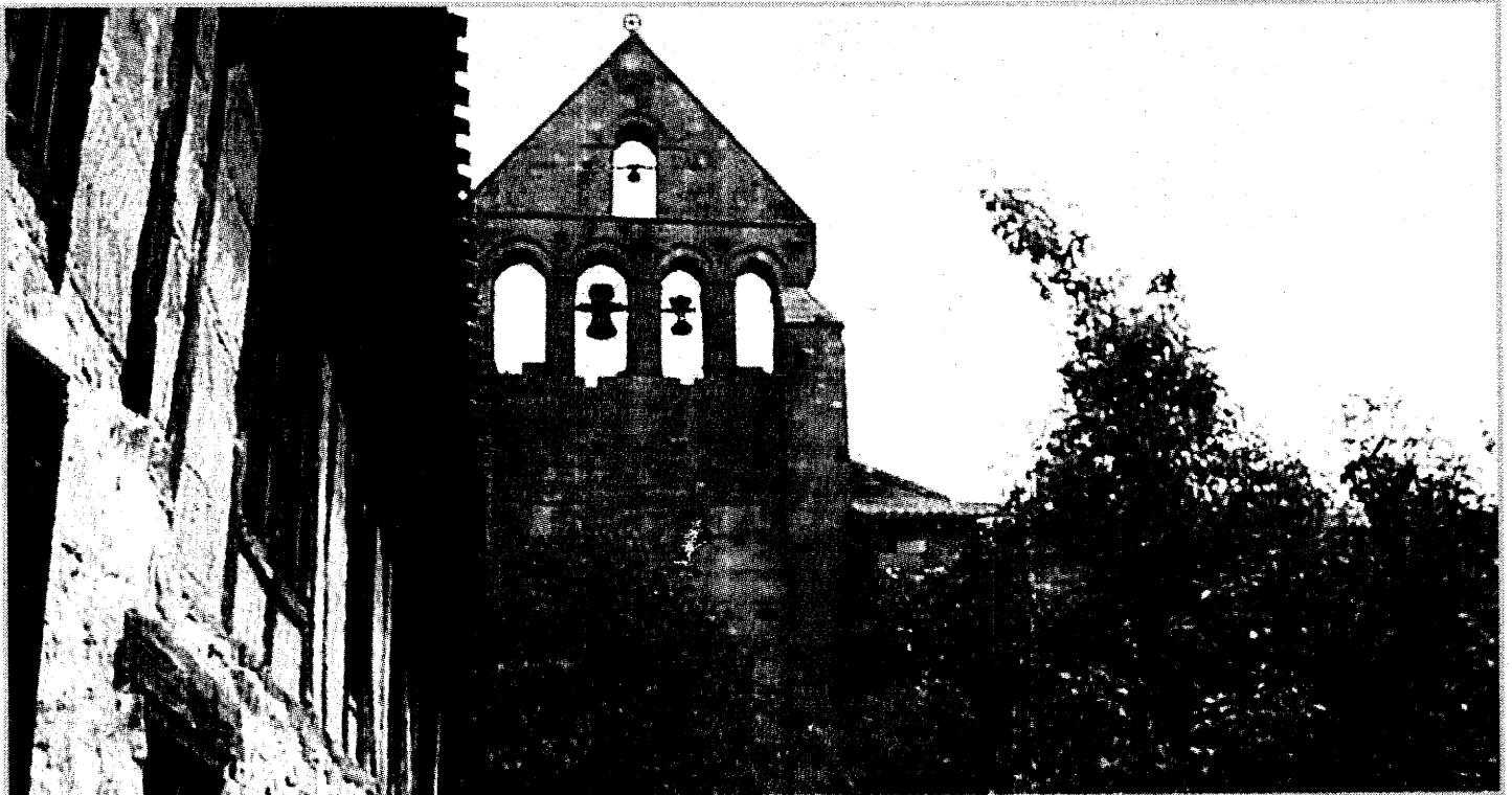
Imagen de la Posada de Santa María la Real, dependiente de la Fundación Santa María la Real de Aguilar de Campoo.

L a Posada de Santa María la Real, dependiente de la Fundación del mismo nombre que tiene su sede en Aguilar de Campoo, ha renovado por tercer año consecutivo la Q de calidad, otorgada por el Instituto para la Calidad Turística Española (ICTE) . La certificación garantiza que el establecimiento, gestionado por la entidad aguilarensa, ofrece un servicio «excelente» a sus clientes.