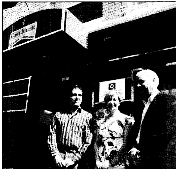
GUADALAJARA DOSMIL La consejera durante una visita a un establecimiento en Alcázar.

Asimismo, la consejera de Economía y Hacienda ha asegurado que estos buenos datos son fruto del esfuerzo de los empresarios de Castilla-La Mancha por la calidad y la dedicación a sus establecimientos, ha resaltado que en el caso concreto del mes de junio los datos de ocupación en turismo rural arrojan que "hemos sido la comunidad