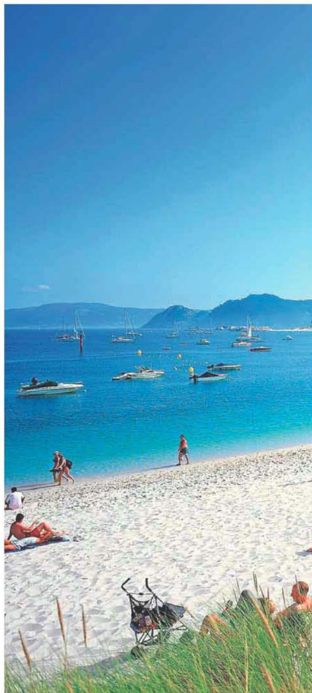
La arena blanca y las aguas transparentes de las Islas Cíes han llevado

El mismo terceto ha contribuido a hacer de las Cíes el Parque Nacional de las Islas Atlánticas y anfitrión de una de las mejores bahías del mundo: la de Rodas. Como tal la proclamó 'The Guardian' en 2007, aunque no es preciso el olfato inglés heredero del querido Watson ni ser uno de los periódicos más prestigiosos del planeta para averiguarlo. Basta desembarcar a la entrada de la ría de Vigo, abandonarse al capricho de las dunas, mirarse al espejo de sus aguas y preguntarse: 'Espejito, espejito, ¿quién es la más bonita?'.