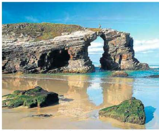
La cala de Las Catedrales, en Ribadeo, traza formas sorprendentes.

En Ribeira, La Coruña, se encuentra el mayor puerto español en volumen de descarga de pescado fresco, y la palmaría demostración de lo traicionera que llega a ser la mar: saca la navaja más grande cuando menos te la esperas, te roba el sentido a golpe de lubinas, almejas, nécoras, cigalas, pulpos y percebes... Hasta que uno se muere de gusto. Menos mal que los 250.000 peregrinos que llegarán a lo largo de este Año Xacobeo a Santiago ganarán el jubileo, y además empezarán a disfrutarlo allí mismo. Porque el paraíso eterno se llama Galicia, fue creado de oro molido y agua bendita. Y es de color azul.