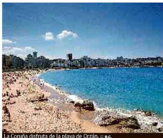
La Coruña disfruta de la playa de Orzán.

mente con las zambullidas en la playa de Las Catedrales, donde veraneaba Leopoldo Calvo Sotelo; en la de Ortigueira, el extremo más al norte del país, o en la interminable de O Grove, con más de 2,5 kilómetros de longitud y una temperatura que no engoca el ombigo sino, bien al contrario, dilata más de lo previsto el chapuzón.