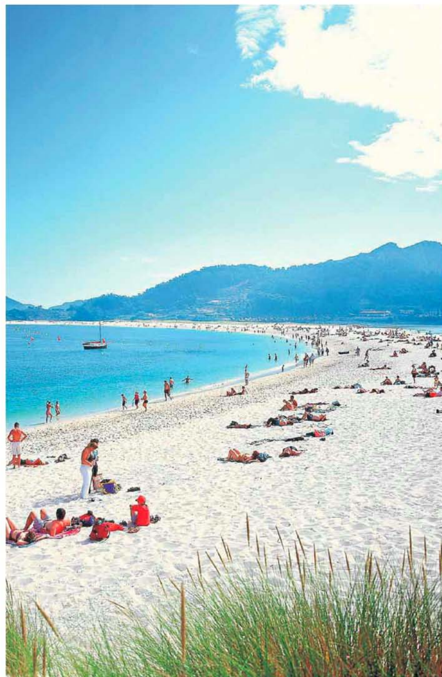
al periódico inglés 'The Guardian' a considerar sus playas como unas de las mejores del mundo.

—Con la diferenciación. Galicia ofrece posibilidades diversas y diferenciadas: los acantilados más grandes de Europa, el único faro romano en uso, la única muralla romana intacta en todo su perímetro, las aguas termales más calientes y fluoradas de la península, cuatro Patrimonios de la Humanidad, gastronomía y un largo etcétera a descubrir por el viajero en una tierra que combina como pocas mito y realidad. Desde la Secretaria Xeral se está haciendo hincapié, además, en la competitividad del sector, que pasa por incidir en la mejora de la calidad, la formación y la gestión. Hemos lanzado también ayudas y trabajamos en la ordenación turística del territorio. Y el broche, que verá la luz en noviembre, será la primera Marca Turística de Galicia, una apuesta decidida por posicionar nuestra oferta en los mercados nacionales e internacionales.