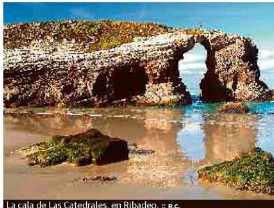
La cala de Las Catedrales, en Ribadeo.

Podría empezar así un largo baño de cultura que refresca la memoria y que se complementa perfecta-