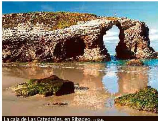
La cala de Las Catedrales, en Ribadeo.

Podría empezar así un largo baño de cultura que refresca la memoria y que se complementa perfecta-