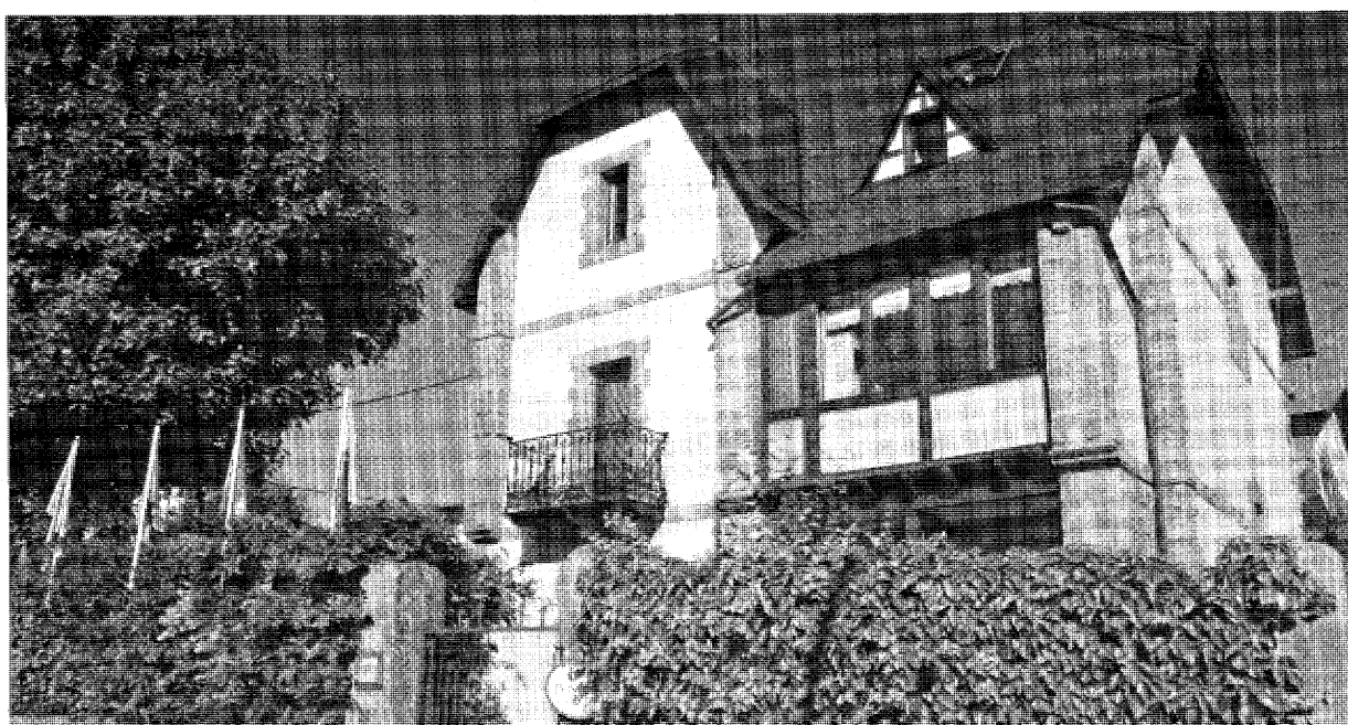
Aspecto parcial del edificio que alberga la Posada Villa Rosa en Reinosa, construido a principios del siglo pasado.

Posada ubicada en un edificio de principios de siglo, de estilo modernista, conservando el sabor de la época. Se encuentra situada dentro del núcleo urbano de Reinosa. Una de las mejores prestaciones de la Posada es la posibilidad de poner a punto el cuerpo gracias al exquisito servicio de Spa