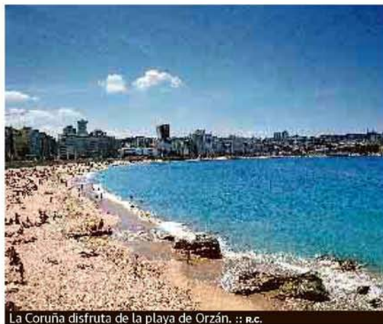
La Coruña disfruta de la playa de Orzán.

mente con las zambullidas en la playa de Las Catedrales, donde veneneaba Leopoldo Calvo Sotelo; en la de Ortigueira, el extremo más al norte del país, o en la interminable de O Grove, con más de 2,5 kilómetros de longitud y una temperatura que no encoge el ombligo sino, bien al contrario, dilata más de lo previsto el chapuzón.