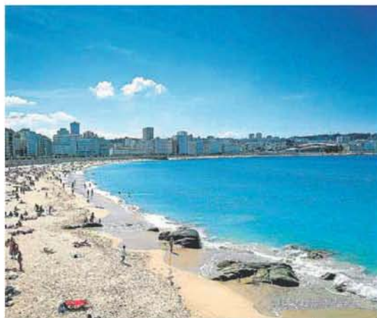
La Coruña disfruta del plácido sonido de la playa de Orzán.

Un parque nacional, seis naturales, cinco reservas de la biosfera, dieciséis rías... demuestran que la madre naturaleza ha acometido numerosas obras maestras en Galicia. Pero también las manos laboriosas y diestras de sus gentes han enriquecido, con igual generosidad y durante siglos, la región: las azuladas cerámicas de Sargadelos, los bordados de las