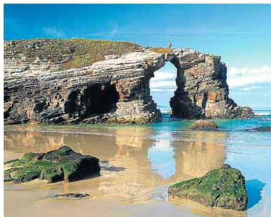
La cala de Las Catedrales, en Ribadeo, traza formas sorprendentes.

En Ribeira, La Coruña, se encuentra el mayor puerto español en volumen de descarga de pescado fresco, y la palmaria demostración de lo traicionera que llega a ser la mar: saca la navaja más grande cuando menos te la esperas, te roba el sentido a golpe de lubinas, almejas, nécoras, cigalas, pulpos y percebes... Hasta que uno se muere de gusto. Menos mal que los 250.000 peregrinos que llegarán a lo largo de este Año Xacobeo a Santiago ganarán el jubileo, y además empezarán a disfrutarlo allí mismo. Porque el paraíso eterno se llama Galicia, fue creado de oro molido y agua bendita. Y es de color azul.