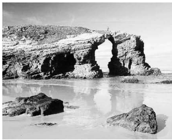
La cala de Las Catedrales, en Ribadeo, traza formas sorprendentes.

Menos mal que los 250.000 peregrinos que llegarán a lo largo de este Año Xacobeo a Santiago ganarán el jubileo, y además empezarán a disfrutarlo allí mismo. Porque el paraíso eterno se llama Galicia, fue creado de oro molido y agua bendita. Y es de color azul.