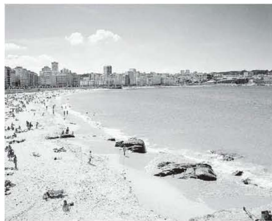
La Coruña disfruta del plácido sonido de la playa de Orzán. :: R.C.

Un parque nacional, seis naturales, cinco reservas de la biosfera, dieciséis rías... demuestran que la madre naturaleza ha acometido numerosas obras maestras en Galicia. Pero también las manos laboriosas y diestras de sus gentes han enriquecido, con igual generosidad y durante siglos, la región: las azuladas cerámicas de Sargadelos, los bordados de las mañosas hilanderas de