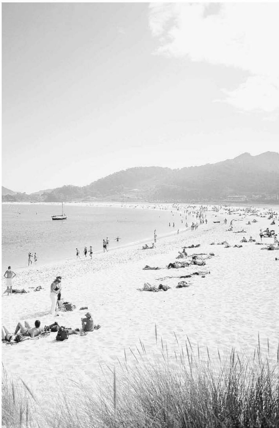
llevado al periódico inglés 'The Guardian' a considerar sus playas como las mejores del mundo. :: R.C.

Con la diferenciación. Galicia ofrece posibilidades diversas y diferenciadas: los acantilados más grandes de Europa, el único faro romano en uso, la única muralla romana intacta en todo su perímetro, las aguas termales más calientes y fluoradas de la península, cuatro Patrimonios de la Humanidad, gastronomía y un largo etcétera a descubrir por el viajero en una tierra que combina como pocas mito y realidad. Desde la Secretaría Xeral se está haciendo hincapié, además, en la competitividad del sector, que pasa por incidir en la mejora de la calidad, la formación y la gestión. Hemos lanzado también ayudas y trabajamos en la ordenación turística del territorio. Y el broche, que verá la luz en noviembre, será la primera Marca Turística de Galicia, una apuesta decidida por posicionar nuestra oferta en los mercados nacionales e internacionales.