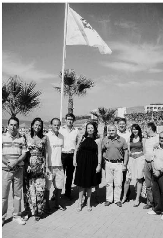
La playa de la Sirena loca ya tiene su bandera Q de calidad. ✉ L.M.