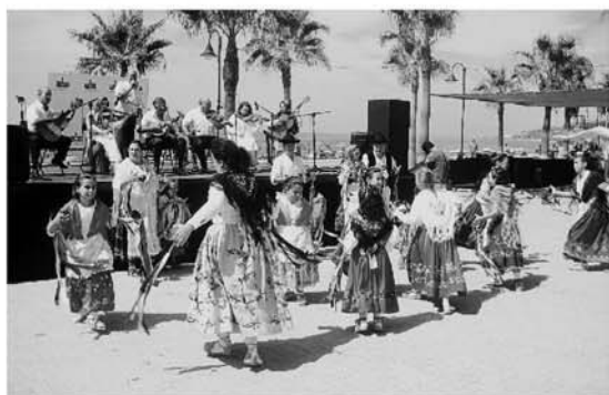
La tradición llegó de la mano de Barranco Almería. ✉ L.M.