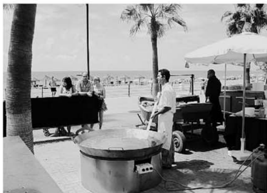
Una gran paella con 25 kilos de arroz puso sabor al día. ✉ L.M.