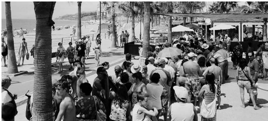
Cientos de personas participaron en estos actos organizados desde el Ayuntamiento de Adra y el Hotel Mirador.

Se esperaba la Q de calidad para el año 2011 pero ya ondea en la Sirena loca