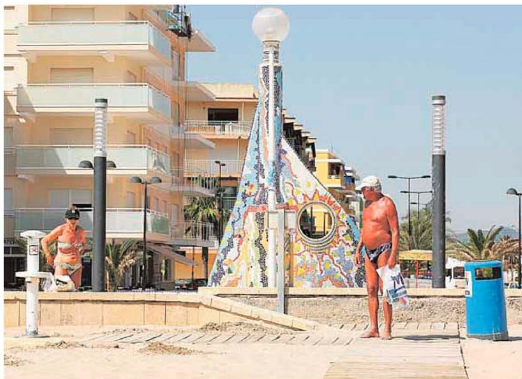
Turistas en la playa de Daimús, que recupera la bandera azul de calidad.