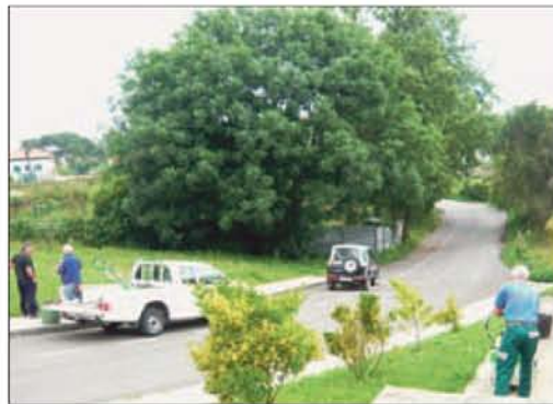
Los vecinos, en plena faena.

estado muy deteriorado, con numerosos baches, lo que había generado numerosas quejas vecinales. Se realizó una limpieza general, luego se allanó con zahorra y finalmente se extendió una capa asfáltica, informa María TORAÑO .