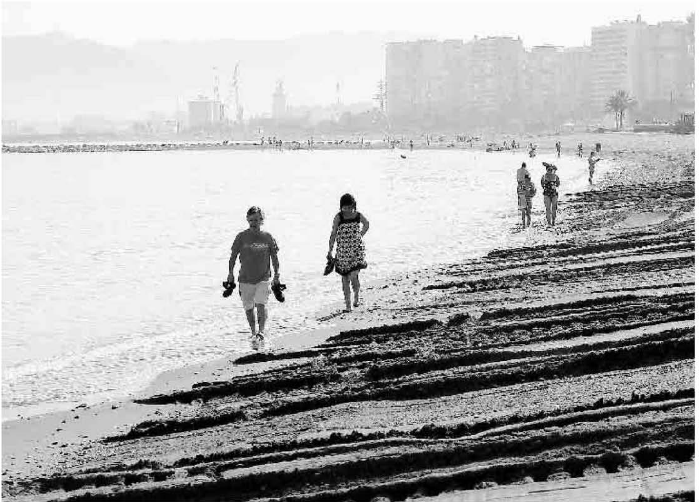
Las playas urbanas de La Malagueta y La Caleta, las más céntricas de la ciudad, han mejorado gracias a los nuevos espigones, que evitan que los temporales de cada invierno se