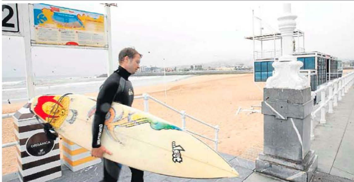
Zona de salvamento del principal arenal gijonés, San Lorenzo. ARMANDO ÁLVAREZ