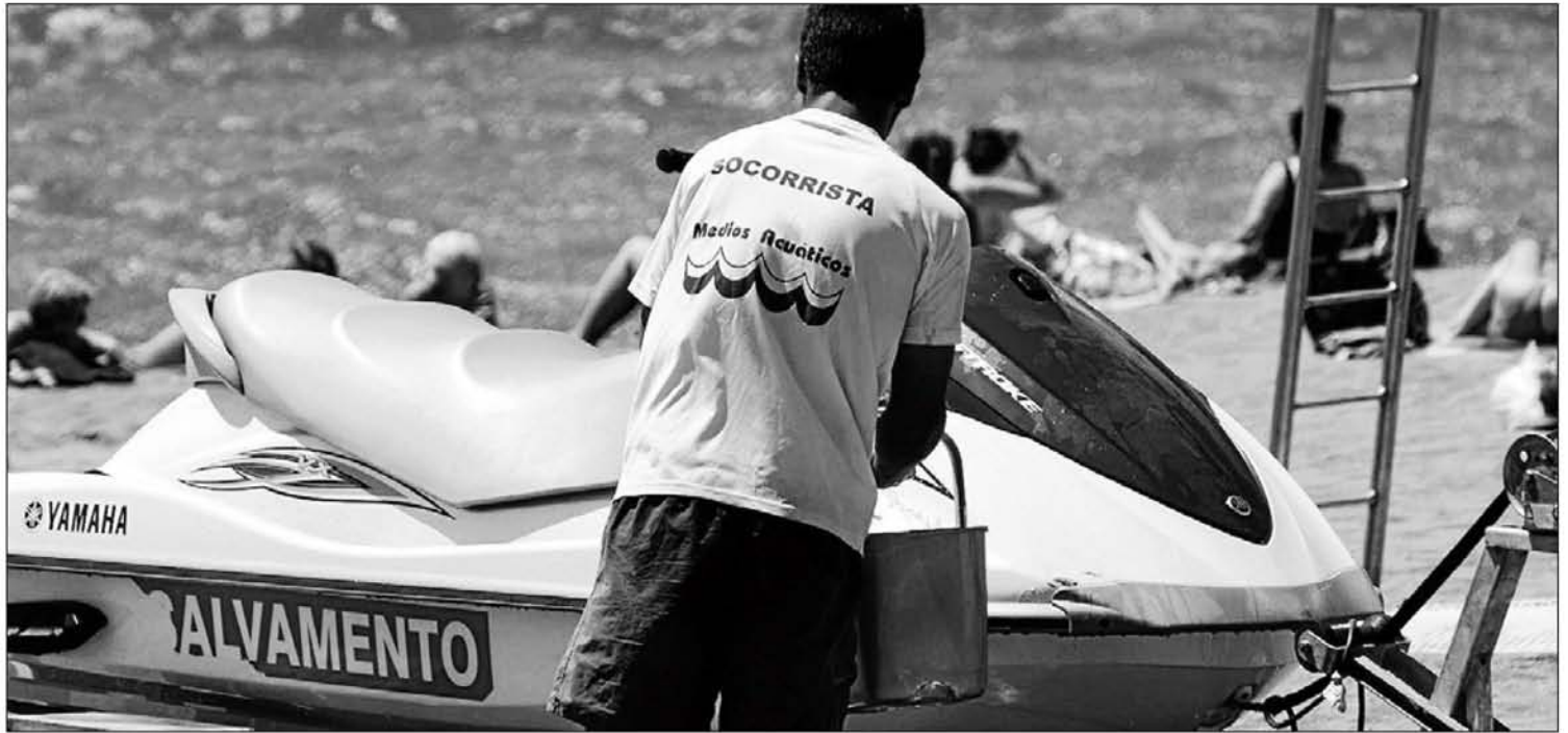
Un socorrista en la playa de La Malagueta en el verano de 2010. CARLOS CRIADO