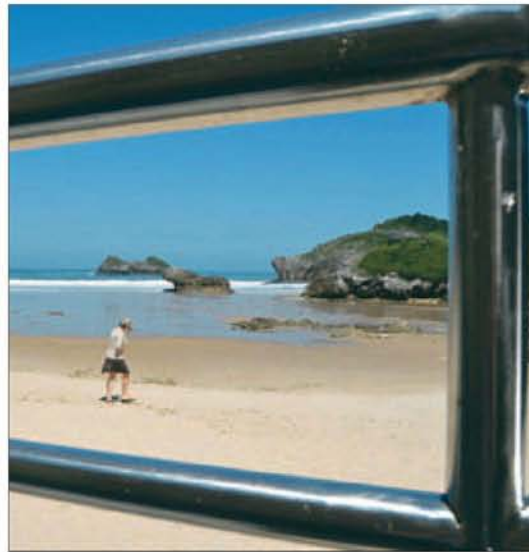
Una mujer pasea por la playa de Las Cámaras, en Celoriu.