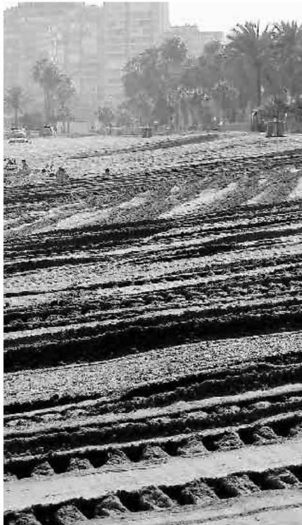
Lleven la arena y destruyan las infraestructuras.

franja prácticamente con el agua golpeando el paseo marítimo y con las infraestructuras destruidas.