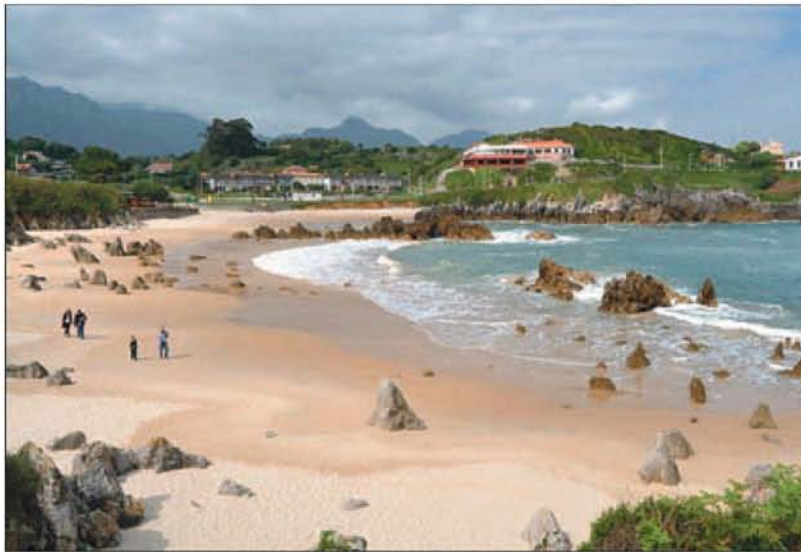
La playa de Toró, situada al este de la villa de Llanes.