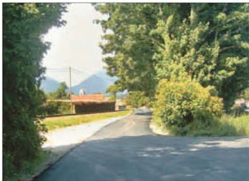
El paso a nivel de Espinas.

de petróleo del «Prestige», tan sólo la recibió Toranda; en 2004 se concedieron cuatro, a Palombina, Toranda, Toró y Barru, que repitieron en 2005 con el Aula del Mar, que se estrenó ese año. Esas mismas cinco banderas fueron concedidas en 2006 y 2007. En 2008 hubo cuatro banderas, para Toró, Borizu, Palombina y el Aula del Mar, mientras que en 2009 se sumó El Sablón en lugar de Palombina. Tengan o no distintivos de calidad, está clara la riqueza paisajística costera del municipio. De hecho, algunas de ellas han sido escenarios para películas de cine, series de televisión o anuncios publicitarios. La última fue la playa de Barru, en la que se grabaron algunas escenas de la nueva temporada de «Doctor Mateo».