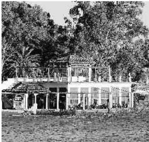
Todos los partidos piden soluciones para los Baños del Carmen. :: SUR

Unión, Progreso y Democracia centrará sus esfuerzos en la solución definitiva de los Baños del Carmen, para que se convierta en un nuevo espacio de esparcimiento ciudadano. Además, promoverá la conexión del paseo marítimo de Pedregalejo con la playa de La Caleta, pero con respeto a la actividad protegida de los astilleros Nereo. Al tiempo, reforzará la limpieza de la arena y de las aguas del litoral de Málaga.