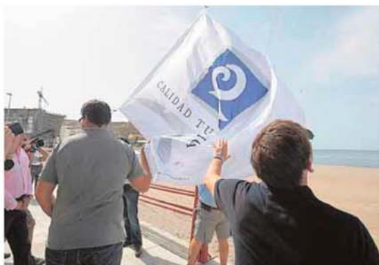
Izan la bandera con la 'Q' de Calidad en una playa. C.M.A.

La Conselleria de Turisme ha apoyado, a través del programa Qualitur, a los municipios que han tratado de obtener este certifica-