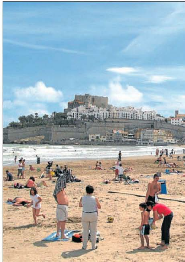
► El consistorio sigue invirtiendo cada año en sus playas, con el fin de tenerlas limpias y disponer del necesario servicio de socorrismo.

Tras la playa Norte, el patronato logró otra Q de calidad a la Oficina de Turismo, y en este caso también fue de las primeras de la provincia