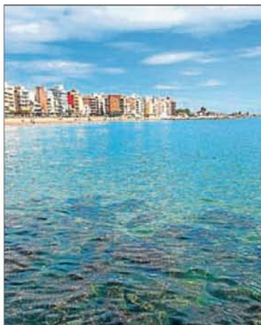
► Las playas de l'Arenal, la Malva-rosa y la del Grao, tres enclaves privilegiados dentro de la costa de Burriana.