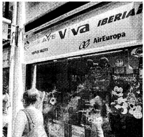
Escaparate de una agencia de viajes.