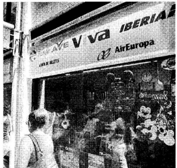
Escaparate de una agencia de viajes.