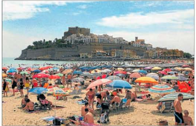
► La playa Norte de Peñíscola, una de las más características de toda la provincia.