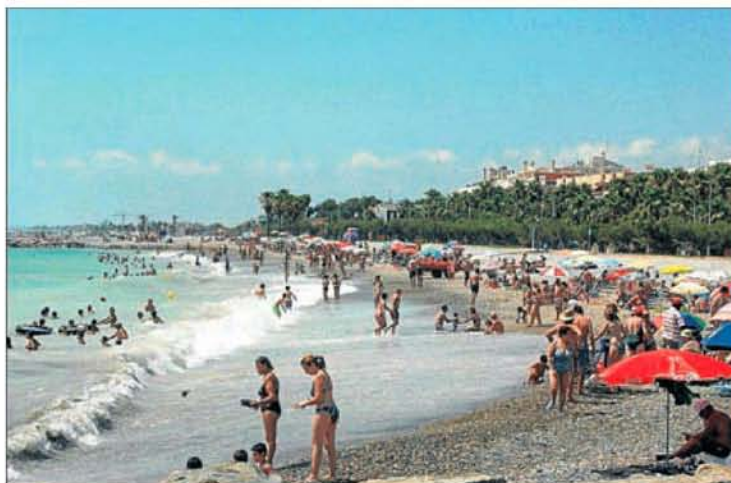
► Otra de las playas reconocidas con la Q de Calidad ha sido Masbò, un referente.