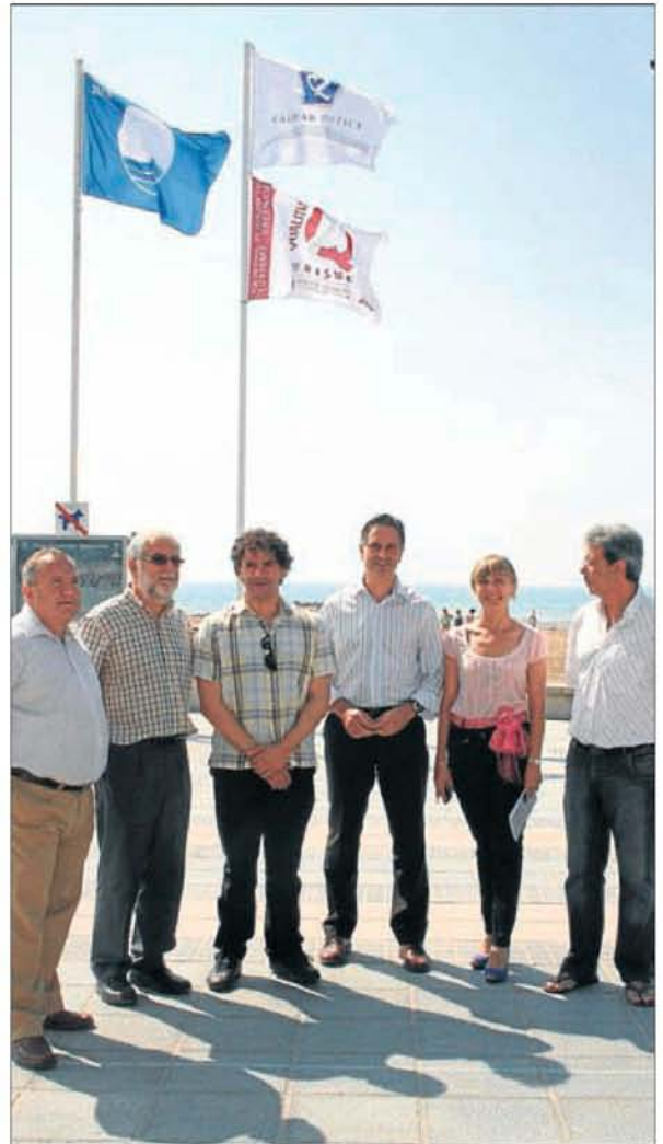
► Las banderas Q de Calidad ondean en el litoral de Benicàssim.

Junto a todo ello, Benicàssim dispone de cinco banderas azules conseguidas por segundo año consecutivo, por lo que es el municipio castellanense con más galardones en su litoral. ■