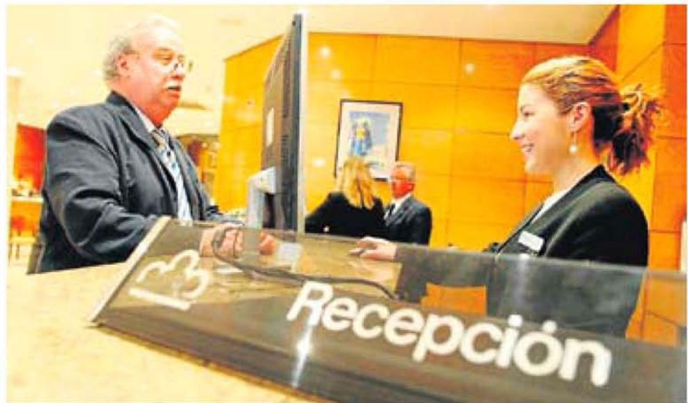
Recepción de un hotel en Oviedo. PABLO LORENZANA

El pesimismo de los hoteleros es importante aunque, con los datos en la mano, se puede hablar de un ligero repunte más allá de ese 1% de los primeros meses de 2011. Por un lado, ese crecimiento se registra pese a que crece la oferta con la apertura de nuevos hoteles, por lo que hay más para repartir. En segundo lugar, ese aumento se advierte en la primera mitad del año, antes de que llegue la avalancha de congresos a la ciudad, lo que ocurrirá en septiembre con dos eventos de más mil asistentes, y antes de que el palacio construido para acogerlos consolide su calendario, lo que podría ser una realidad el año que viene. Es decir, todo pare-