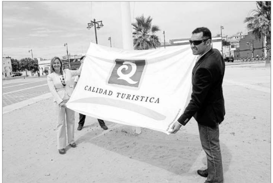
La concejala de Playas junto al delegado de Cruz Roja con la bandera «Q» de calidad.