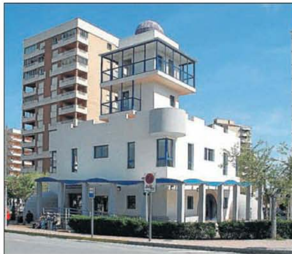
► La tourist-info de Orpesa también cuenta con la Q.

En esta línea, desde la corporación municipal se decide, en el 2008, implantar y certificar la norma Q, UNE 187003, en la Oficina de Turismo, con objeto de garantizar que todas aquellas actividades relacionadas con la actividad turística del municipio se realizan siguiendo