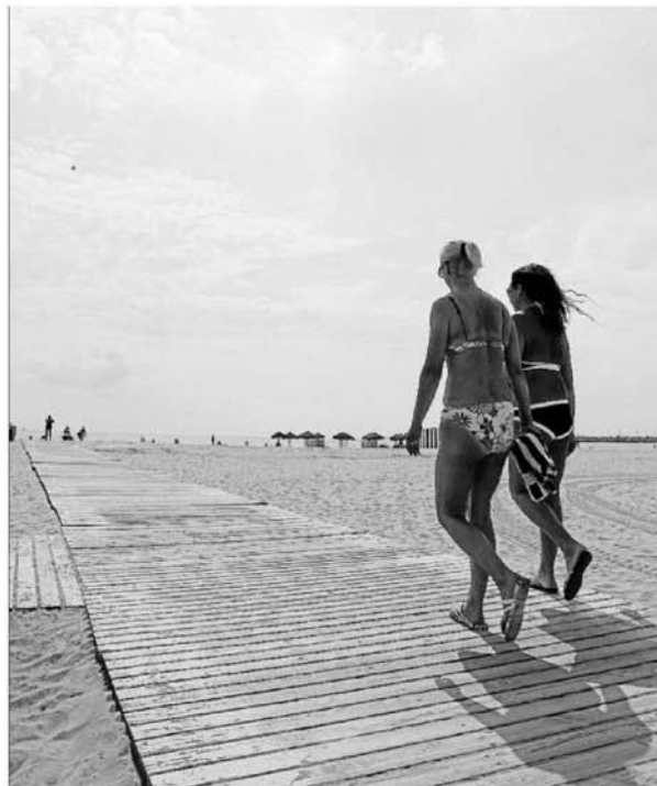
Bañistas sobre las nuevas tablas de la Malva-rosa.