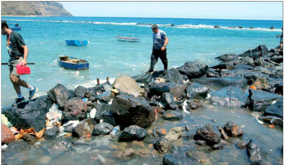
Basura en la playa de Las Teresitas, justo al inicio de la zona de baño.

Precisamente muchas han sido las quejas de los vecinos por el estado de deterioro en el que se encuentra la playa y han pedido a gritos su mejora, independientemente de los litigios judiciales en los que se ha visto inmersa, y que llevaron a la paralización del proyecto de reordenación del frente marítimo, que tenían que ejecutar el Ayunta-