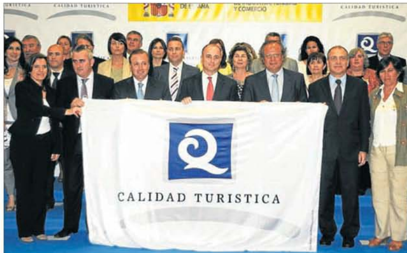
► La reciente entrega de las banderas Q de Calidad por parte del Ministro de Industria y Turismo.

En el 'reperto' de sellos de calidad, el litoral de Castellón ha sido