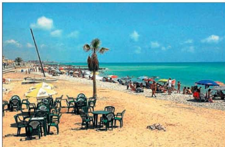
► La playa Grau ha sido distinguida con este prestigioso certificado de calidad.