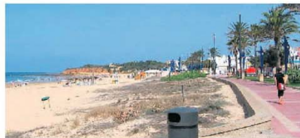
El arenal chiclanero es uno de los más grandes de la provincia. :: J. M. A.

miento de «arbitraria», La Barrosa sí tendrá el certificado ISO 14001 o la 'Q' de Calidad Turística, así como numerosos servicios públicos.