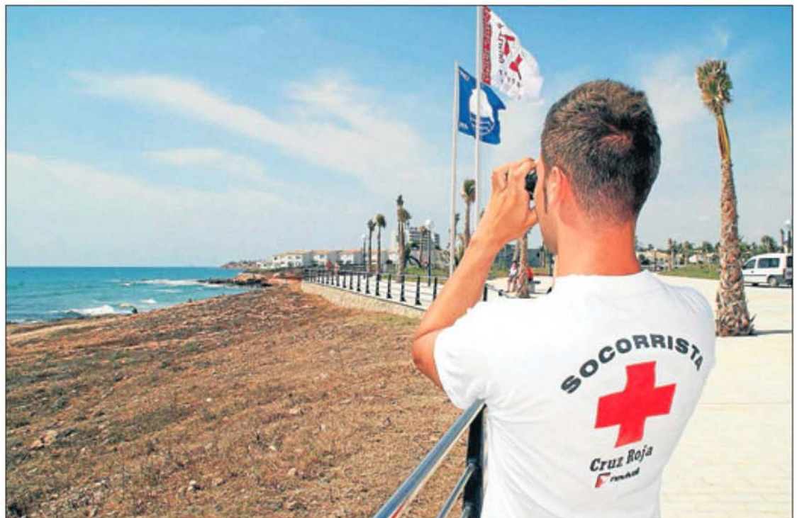
Las playas del municipio poseen ocho banderas azules. LOINO

Por su parte, la Policía Local reforzará las patrullas de los tres turnos en Orihuela Costa durante los meses estivales, puesto que esta zona sufre un incremento de la población considerable. Y es que, durante el verano, la cifra de residentes pasa de 30.000 a 200.000, aproximadamente. Asimismo, tres agentes vigilarán las zona de playa en bicicleta y el Ayuntamiento dispondrá un servicio de vigilancia de playas. Este último grupo de trabajadores se encarga de comprobar que no hay ningún desperfecto y que los servicios funcionan correctamente. Asimismo, avisan a la Policía Local en caso de detectar cualquier