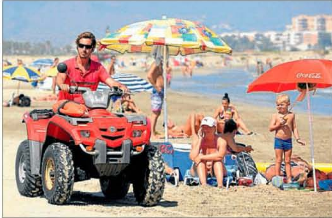
► El Gurugú, una de las zonas reconocidas por el Instituto para la Calidad Turística.

Domingo, 12 de junio del 2011 el Periódico Mediterráneo