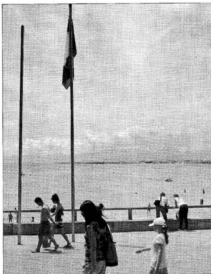
► El estandarte concedido por Europa avala la calidad y la gestión de las playas. La capital de la Costa Daurada lucirá este año dos.

Por otro lado, las playas de Llevant y Ponent cuentan con la certificación Q de Calidad Turística Española que otorga el Instituto para la Calidad Turística (ICTE), entidad privada de certificación especialmente creada para el desarrollo de la calidad en el sector turístico. Esta certificación es entregada por la Secretaría General de Turismo y depende directamente del Ministerio. En España hay 176 pla-