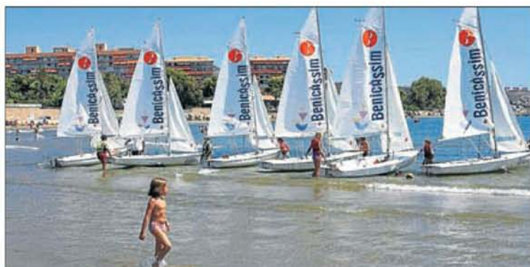
► La zona de la Torre de Sant Vicent, una de las más apreciadas en la provincia.