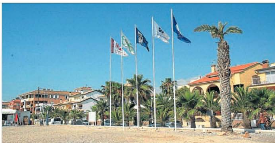
► Distintos reconocimientos ondean, en forma de bandera, en la tercera playa moncofense, Pedra-roja.