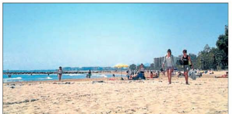
► La playa de Voramar, una de las tres condecoradas para esta temporada veraniega.