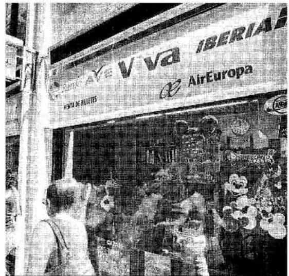
Escaparate de una agencia de viajes.