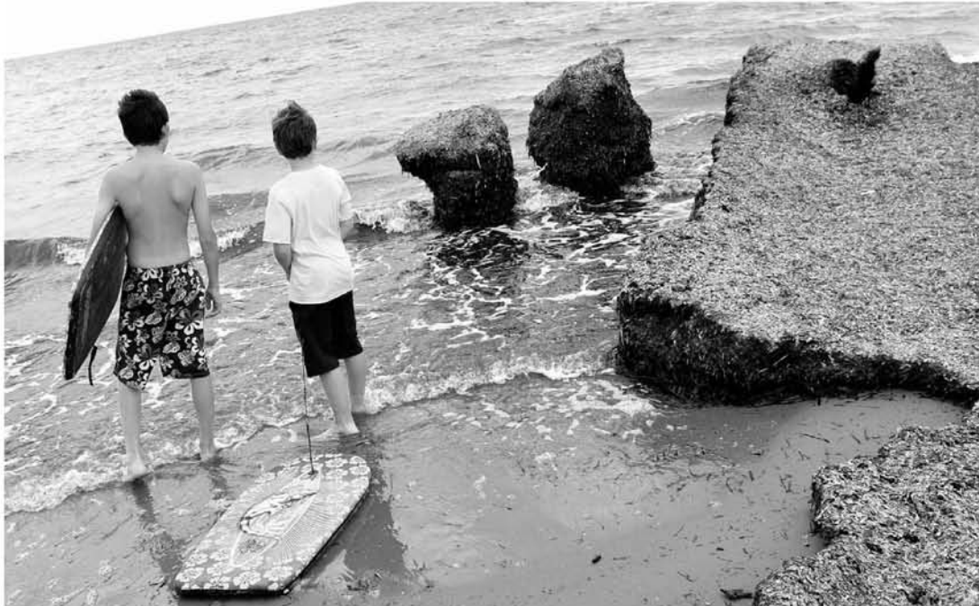
Dos niños observan a su derecha varias 'escolleras' naturales de algas que no invitan precisamente al baño. Ellos no lo hicieron.