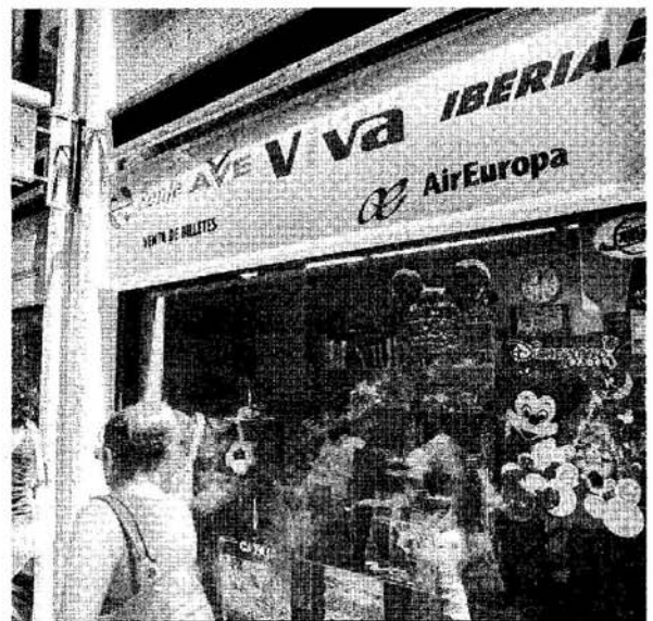
Escaparate de una agencia de viajes.