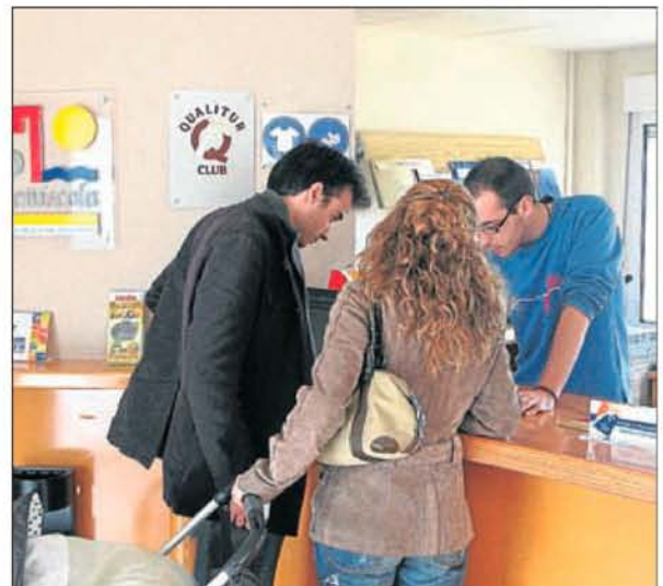
► La Oficina de Turismo es un polo de atracción para los nuevos visitantes y para aquellos que quieran saber las novedades locales.