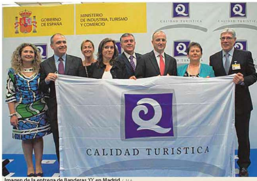
Imagen de la entrega de Banderas 'Q' en Madrid. C.M.A.

CALIDAD De las 176 banderas concedidas en España, 47 corresponden a 26 municipios de la Comunitat