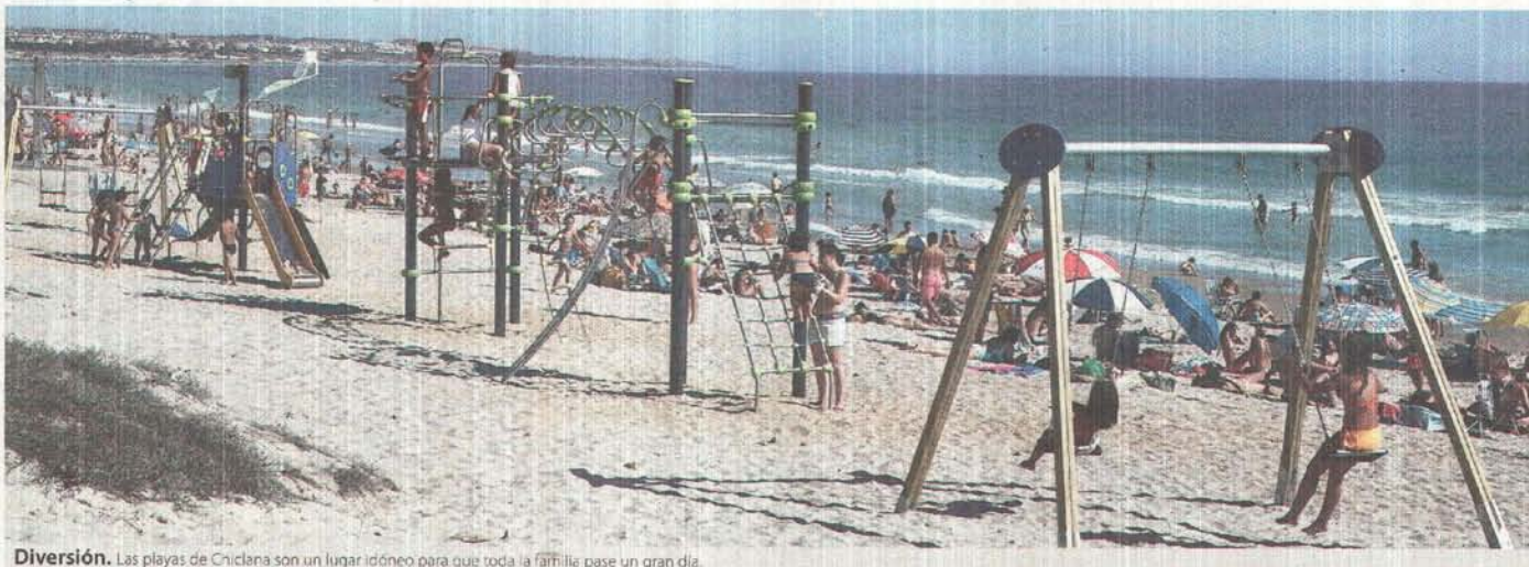
Diversión. Las playas de Chiclana son un lugar idóneo para que toda la familia pase un gran día.

Es indudable que sobran argumentos para elegir La Barrosa como lugar de vacaciones y así lo entienden los principales touroperadores y empresas del sector en Europa, que no han dejado de mirar a La Barrosa como destino preferente en sus ofertas. En un primer momento el mercado alemán fue el que con mejores perspectivas centró sus operaciones en Chiclana, pero en los últimos años la procedencia británica, francesa, belga y finesa da muestras de la apertura de canales de negocio en buena parte de Europa.