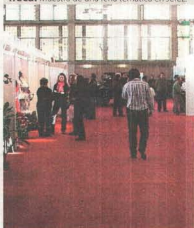
Ifeca. Muestra de una feria temática en Jerez.

la consecución de la distinción de la Q de calidad turística. Los datos hablan por sí solos. En 2010 acogió 121 actos, lo que supuso que más de 40.000 personas pasaran por sus instalaciones. Se estima que supuso para la ciudad la llegada de diez millones de euros. Para este año, los congresos más importantes que esperan recibir son la 25 Conferencia de la Sociedad Europea de Cetáceos, el Congreso Universidad y Cooperación el Congreso Nacional de Bibliotecas Virtuales.