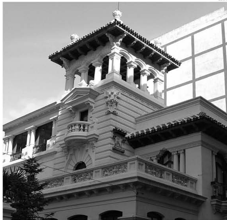
La Cámara de Comercio la Delegación ICTE, que otorga esta distinción.

La marca Q de Calidad Turística Española es el elemento más visible de todo el Sistema de Calidad Turístico Español,