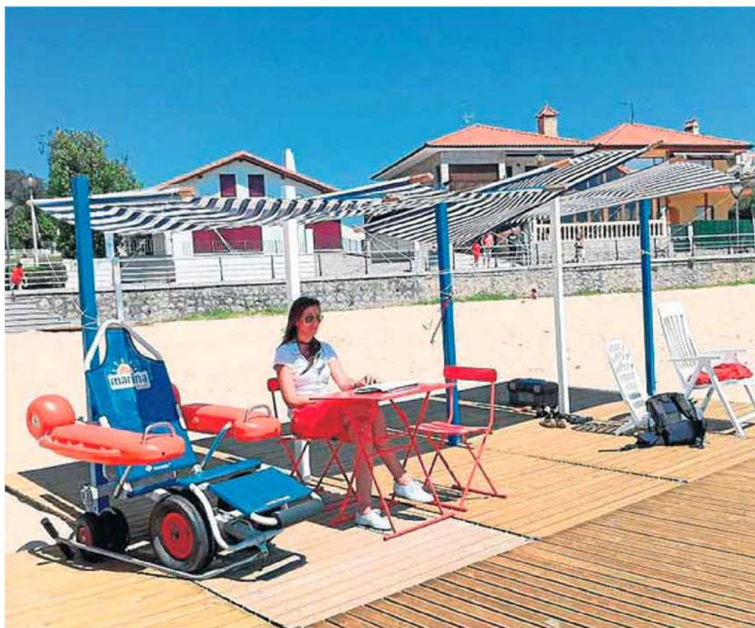
Isla ha preparado sus playas para que los discapacitados estén más cómodos.