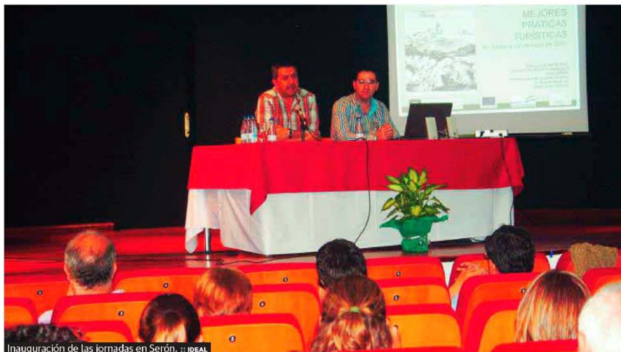
Inauguración de las jornadas en Serón.