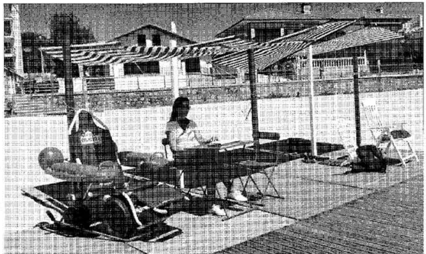
Silla anfibia preparada para facilitar el baño a las personas con discapacidad motora.

con toldos y plataformas de madera reservada a personas con movilidad reducida, la adquisición e una silla anfibia de apoyo al baño y la contratación de personal de información y apoyo a las personas con discapacidad en horario de 11,30 a 14,30 y de 16,00 a 19,30 horas todos los días en julio y agosto y los fines de semana de junio y septiembre. El Consistorio aprobó a finales de 2010 el Plan Integral de Accesibilidad del municipio, en el que se contempla la accesibilidad universal a todos los espacios y servicios públicos del municipio. Una de las primeras actuaciones llevadas a cabo ha consistido en dotar de servicios de accesibilidad a las playas de La Arena y El Sable, en Isla.