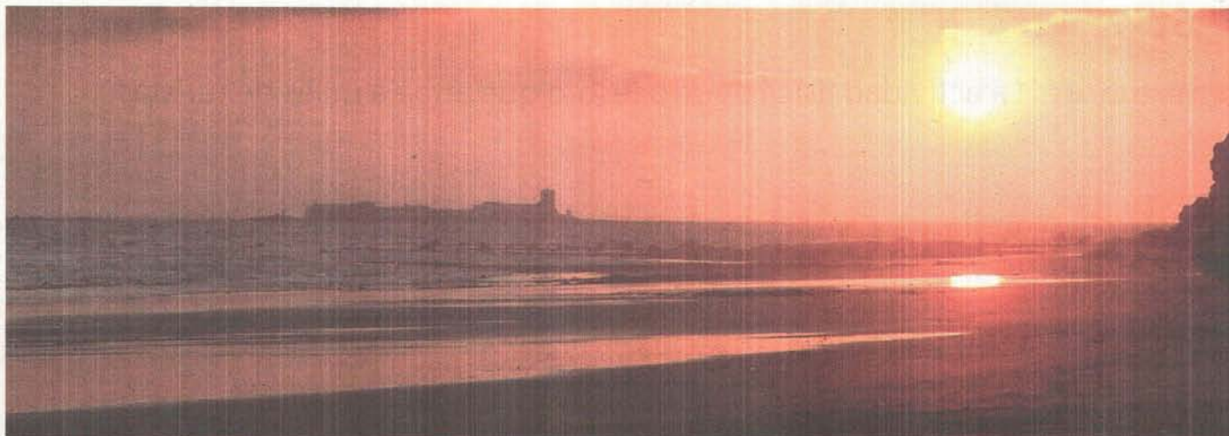
Paraíso. La playa de la Barrosa está enclavada en un ambiente paradisíaco dotado de todos los servicios.

CHICLANA Este célebre lugar de la costa gaditana es el mejor aval contra la crisis del turismo