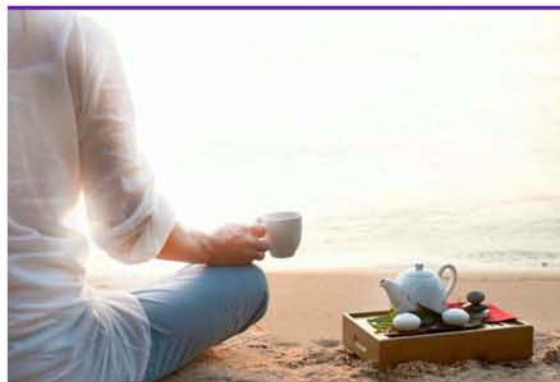
El turismo de salud contribuirá a la diversificación de la oferta española.

Por su parte, la Secretaría de Estado de Turismo se ha comprometido a conceder una subvención al clúster por un importe de 25.000 euros. Una partida que se destinará a posicionar España en el ámbito internacional y a la captación de pacientes extranjeros en los mercados prioritarios como Reino Unido, Alemania, Bélgica, Suecia, Noruega, Finlandia, Rusia, Marruecos y EE UU.