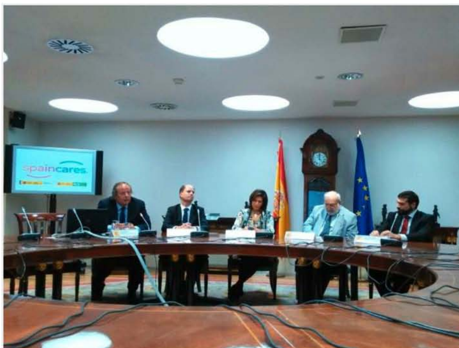
El número de visitantes atraídos por el turismo de salud en España se duplicará en cinco años

El nuevo proyecto 'SpainCare', dotado con una inversión de 2,7 millones, captará pacientes extranjeros