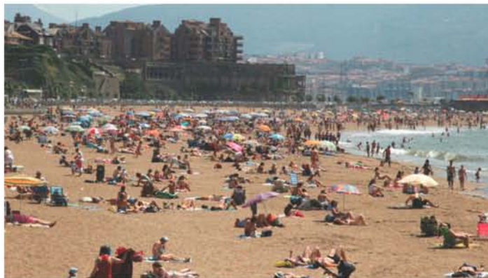
Imagen de archivo de la playa de Ereaga. (Juan Lazkano)

Bizkaia ha concluido su temporada de playas con un total de 2,73 millones de usuarios, un 42% menos que el año pasado debido a "la escasez" de días soleados de este verano, y una valoración general de 7,93 sobre 10. La temporada ha transcurrido con "normalidad y ausencia de incidentes" importantes, según ha destacado el diputado de Medio Ambiente, Iosu Madariaga.