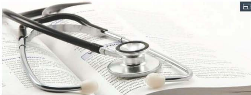
Imagen de un estetoscopio