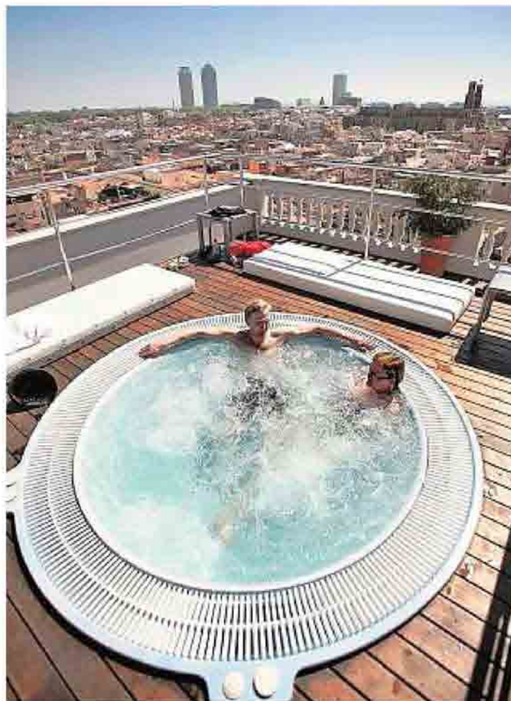
Las «Q» reconocen, entre otros parámetros, a los hoteles. JOB VERMEULEN

León, Asturias y Murcia. En el extremo opuesto del ránking y entre las comunidades menos desarrolladas turísticamente se encuentran Extremadura, con un total de 31 locales certificados, La Rioja, con 22, Melilla con cinco y en el último lugar aparece Ceuta con una sola «Q» de certificación.