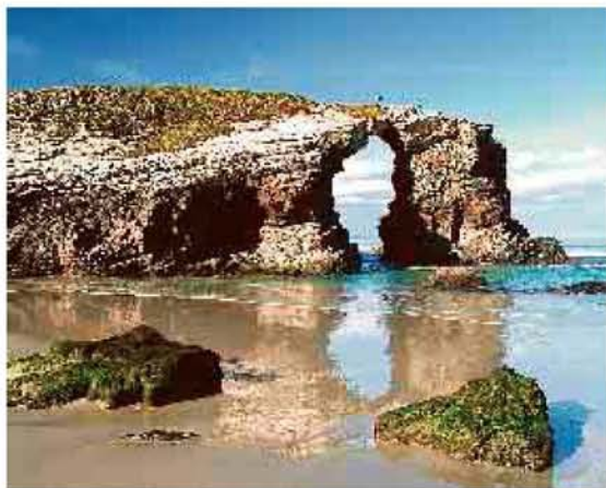
La cala de Las Catedrales, en Ribadeo, traza formas sorprendentes.

Menos mal que los 250.000 peregrinos que llegarán a lo largo de este Año Xacobeo a Santiago ganarán el jubileo, y además empezarán a disfrutarlo allí mismo. Porque el paraíso eterno se llama Galicia, fue creado de oro molido y agua bendita. Y es de color azul.