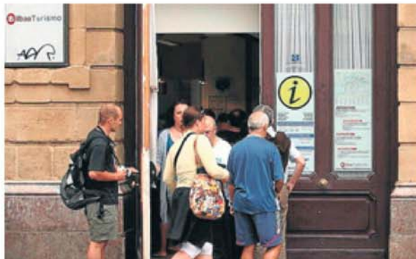
Un grupo de turistas entra en la oficina de turismo de Bilbao.

El informe incorpora tanto hoteles como servicios de restauración, agencias de viajes, playas, estaciones de esquí, oficinas de información turística y espacios protegidos, que cumplen los requisitos exigidos por el ICT para hacerse merecedores de ese símbolo de calidad que