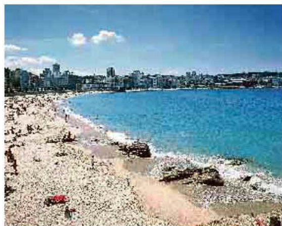
La Coruña disfruta del plácido sonido de la playa de Orzán.

Un parque nacional, seis naturales, cinco reservas de la biosfera, dieciséis rías... demuestran que la madre naturaleza ha acometido numerosas obras maestras en Galicia. Pero también las manos laboriosas y diestras de sus gentes han enriquecido, con igual generosidad y durante siglos, la región: las azuladas cerámicas de Sargadelos, los bordados de las mañosas hilanderas de