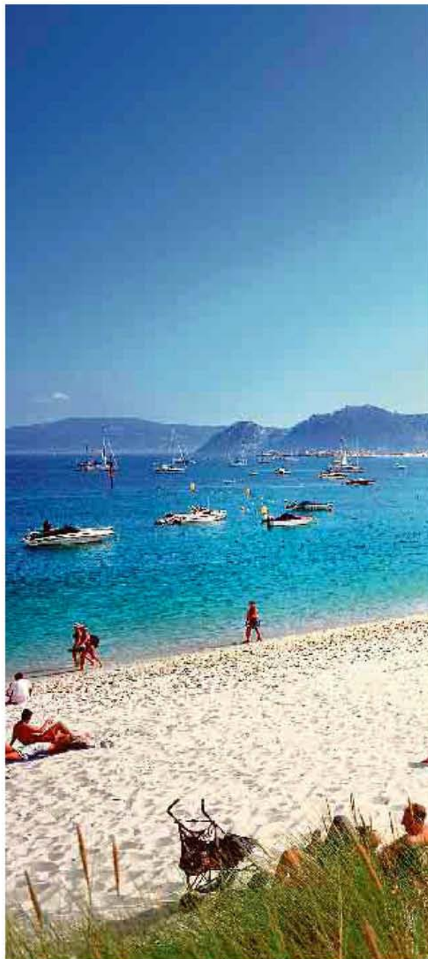
La arena blanca y las aguas transparentes de las Islas Cíes han

El mismo terceto ha contribuido a hacer de las Cíes el Parque Nacional de las Islas Atlánticas y anfitrión de la mejor bahía del mundo: la de Rodas. Como tal la proclamó 'The Guardian' en 2007, aunque no es preciso el olfato inglés heredero del querido Watson ni ser uno de los periódicos más prestigiosos del planeta para averiguarlo. Basta desembarcar a la entrada de la ría de Vigo, abandonarse al capricho de las dunas, mirarse al espejo de sus aguas y preguntarse: 'Espejito, espejito, ¿quién es la más bonita?'.