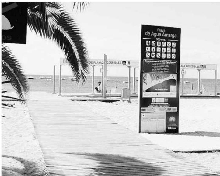
Playa de Aguamarga, equipamiento y calidad. :: IDEAL