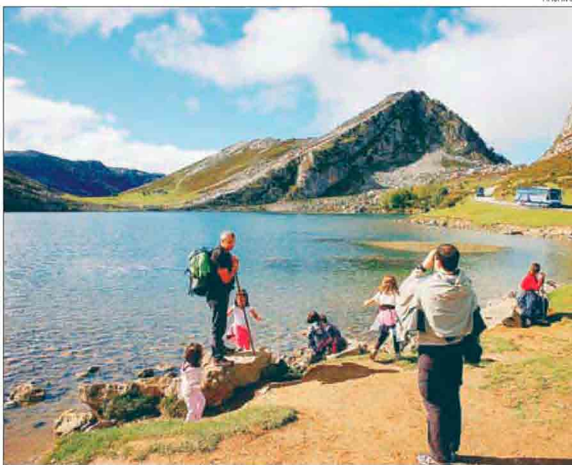
►► Turistas visitan Los Lagos de Covadonga.

Y, aunque la crisis económica marca los hábitos a la hora de viajar, cada turista se gasta, de media, entre 350 ó 370 euros