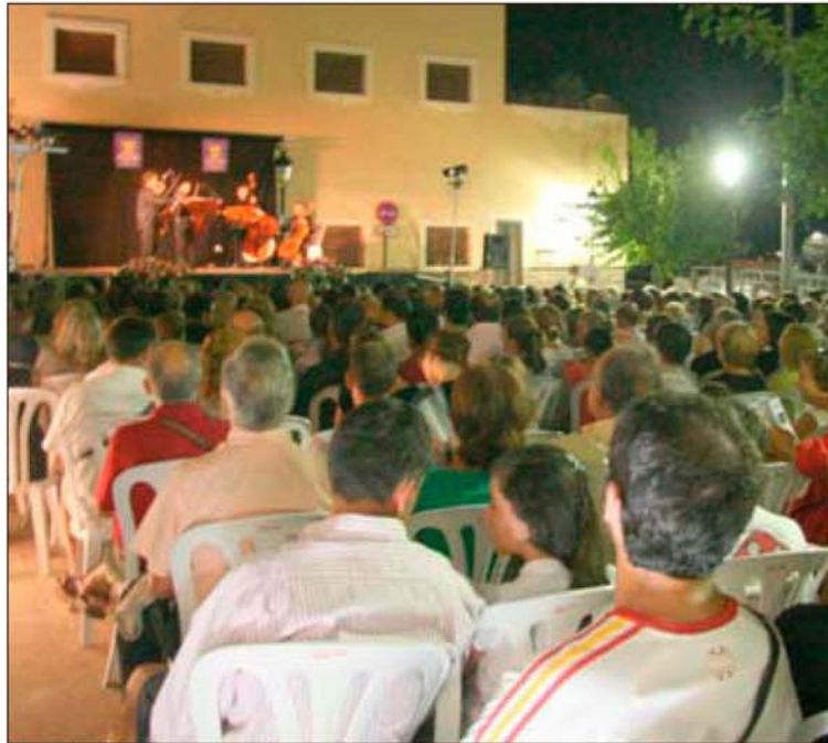
El Festival Orfim cuenta con una gran afluencia de público.