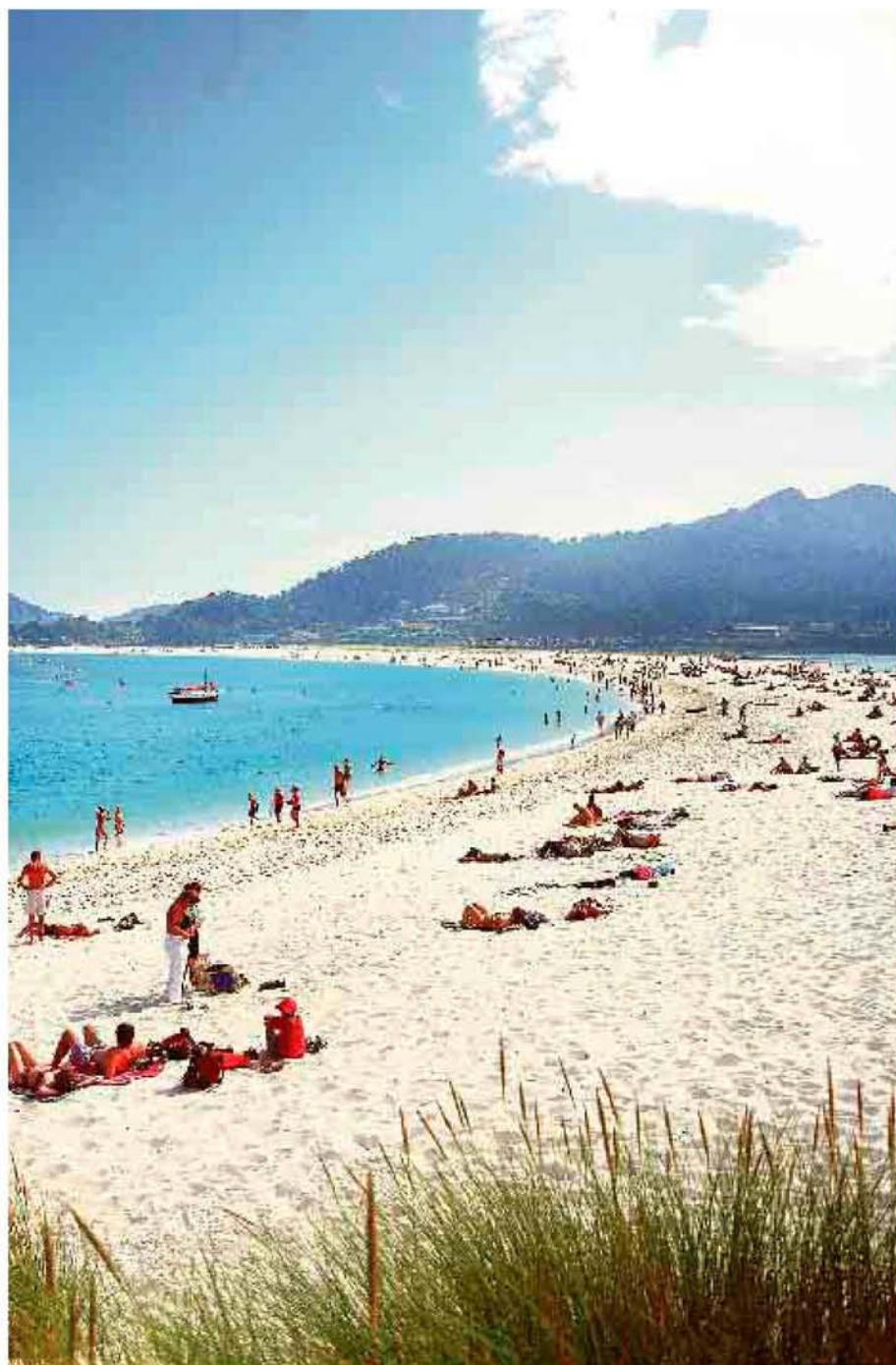
llevado al periódico inglés 'The Guardian' a considerar sus playas como las mejores del mundo. :: R. C.

Camariñas... Por no hablar de las empanadas, albariños y demás artesanía para el paladar.