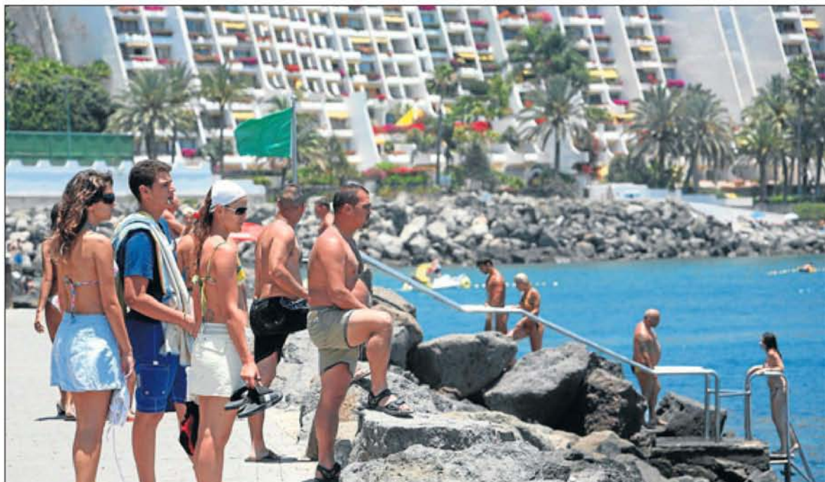
Modelo afianzado. Canarias suma 150 complejos que operan bajo la modalidad de tiempo compartido. El de Anfi del Mar, en Mogán, fue uno de los pioneros.