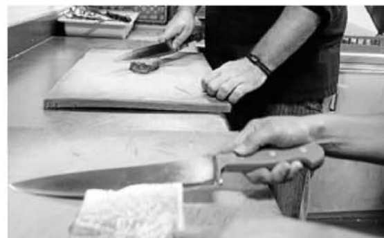
Los utensilios son de diferente color para carne y pescado.

No es frecuente que se produzca una intoxicación alimentaria, pero sí sucede el equipo de municipal realiza la investigación y el seguimiento de los brotes de toxoinfección alimentaria en coordinación con el Servicio de Epidemiología del Gobierno vasco. En el año 2008, se notificaron siete brotes de infección alimentaria, en los cuales hubo un total de 73 personas afectadas. El agente etiológico más frecuente