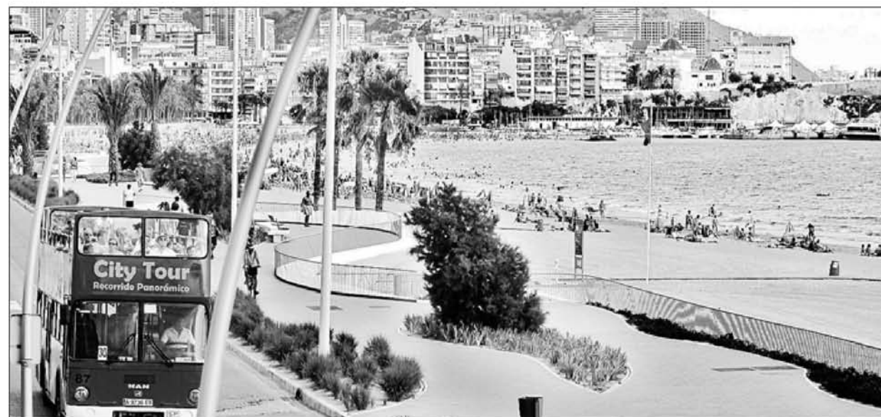
La playa de Poniente de Benidorm, que este año ha obtenido por primera vez en su historia la «Q» de Calidad, ayer. ALVARO SALUDINÓS