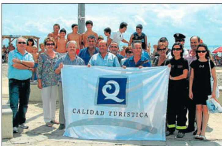
Las autoridades y los bañistas posaron ayer con la bandera. M. J. M. G.

solución se conoció la pasada semana y que se suman a las que se otorgaron anteriormente a las oficinas de turismo de La Ribera y La Manga. Para obtener este galardón ha sido necesario seguir unos rigurosos controles de limpieza y de calidad de agua y arena, que incluyen análisis periódicos. Asimismo, se evalúa la cantidad y calidad de los servicios generales del entorno playero, aseos, actividades, señalización y previsiones de posibles emergencias. M. J. MARTÍNEZ GARCERÁN