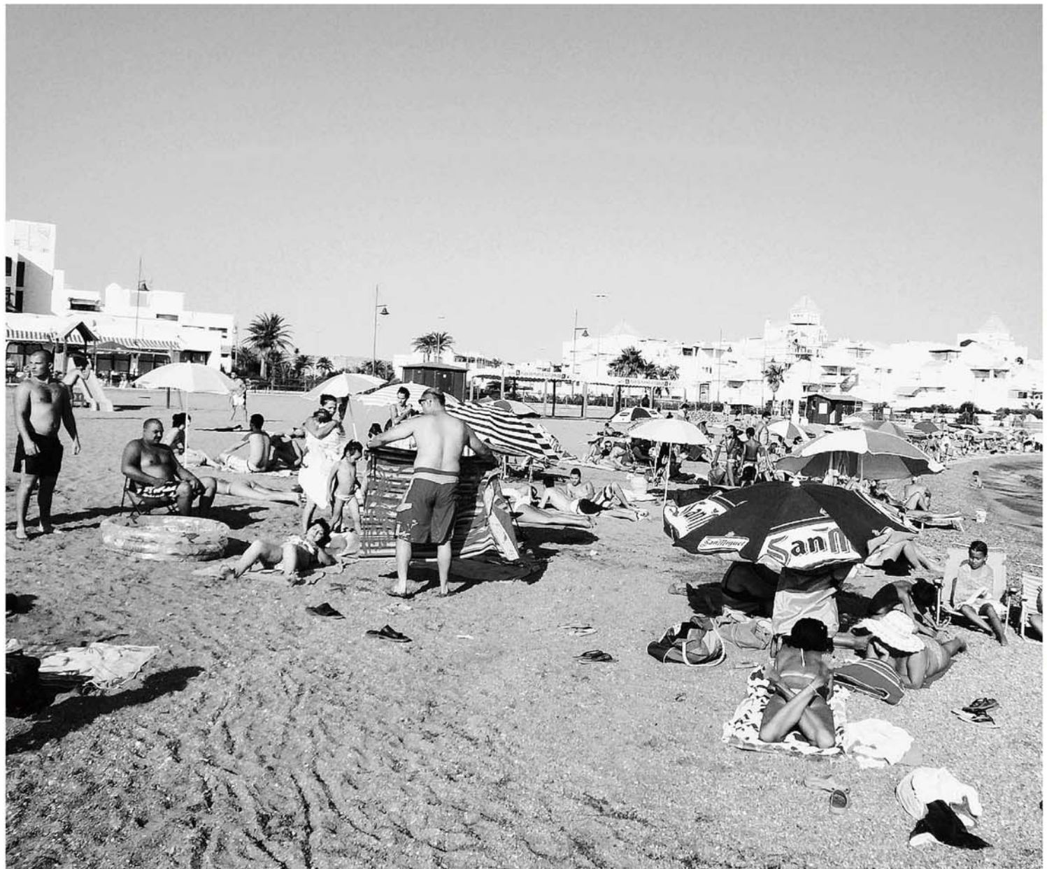
La playa de Levante de Almerimar es una de las que más afluencia de bañistas registra cada verano, debido en gran parte a su cercanía con las viviendas, de la urbanización. ■ M. A. D.

Durante todo el verano, las playas ejidenses, algunas de ellas con bandera azul y otras con la 'Q de Calidad Turística' ondeando, han registrado una alta afluencia de usuarios. Y es que, el buen tiempo ha acompañado y ello ha provocado al mismo tiempo que los chiringuitos fijos y los desmontables de Balerna, así como los establecimientos cercanos a la franja costera, hayan sobrevivido, a pesar de la crisis que muchos no ven aún como pasajera. Aún queda verano por delante, por lo que las playas ejidenses volverán a convertirse en punto de encuentro, acogiendo a miles de ciudadanos que disfrutan al sol.