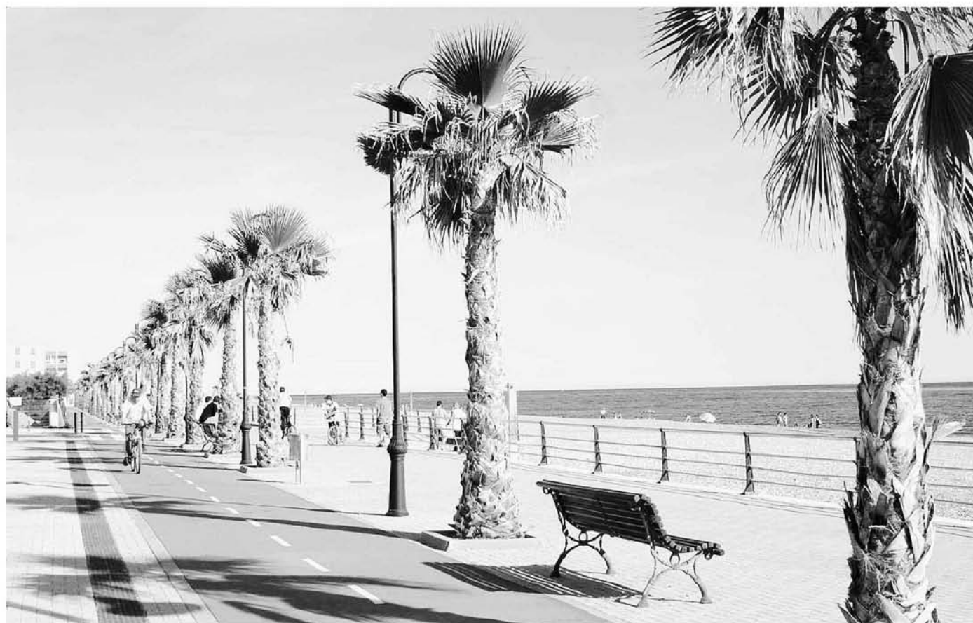
La playa de la Sirena loca se ubica junto al paseo marítimo de Poniente y la piscina municipal cubierta.