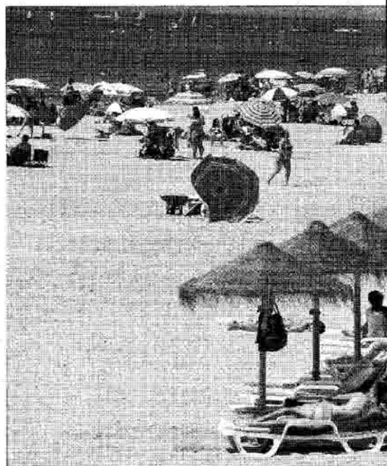
PANORÁMICA. En la imagen se observa la línea de playa de La Antilla.

Este barrio conserva su aire tradicional y sus arraigadas costumbres; y en el horizonte, aún hoy se pueden ver las bar-