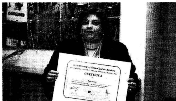
Momento en el que reciben el galardón del Pazo da Cruz