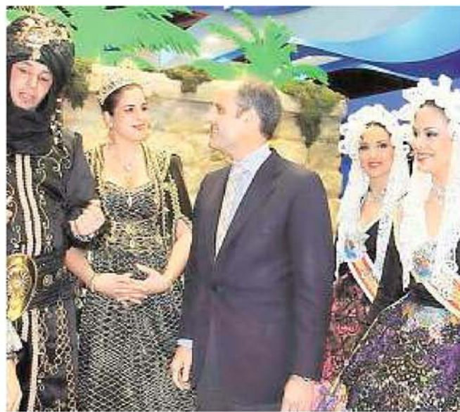
Camps, con las Belleas y representantes de Moros y Cristianos