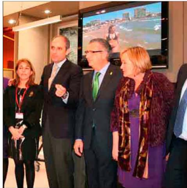
El jefe del Consell, ayer junto al alcalde y la consellera de Turismo.

Entre ellas, este año hay que destacar la distinción que ha recibido la playa de la Conxa por las magníficas instalaciones de que dispone. El alcalde recogió el pasado miércoles por la noche la Q de calidad en el tradicional acto que se realiza en el palco del Santiago Bernabéu en Madrid.