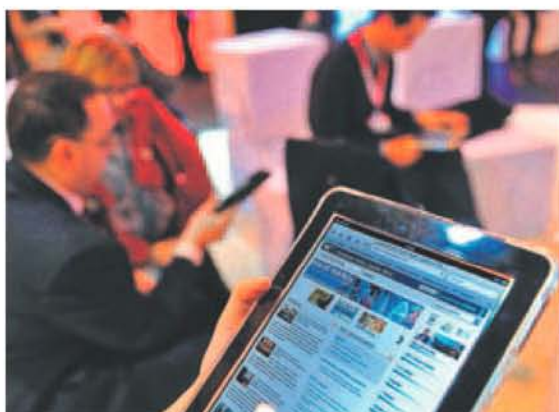
El espacio de Euskadi se vale también de las nuevas tecnologías.