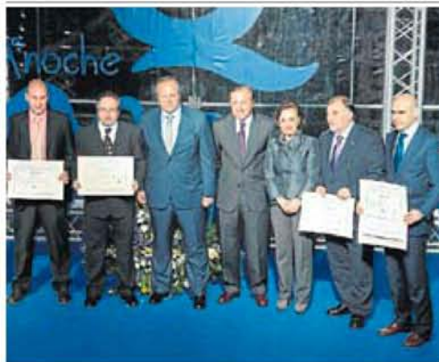
Mesquida, Álvarez y premiados con la Q de calidad.

El miércoles se daba el pistoletazo de salida al mayor escaparate de turismo y lo hacía de la mano de la Doña Sofía a la que pudimos ver saludando a la consejera de Turismo. Ayer, Fitur continuaba con su agenda y acogía el acto de entrega del diploma que acredita la Q de calidad. Lo hicie-