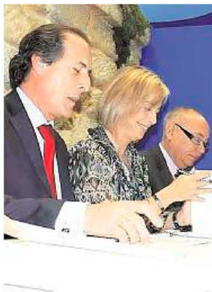
Los alcaldes impulsarán el turismo náutico