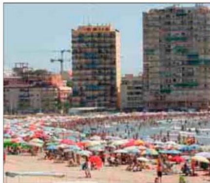
La playa de la Conxa, distinguida con la 'Q' de calidad.