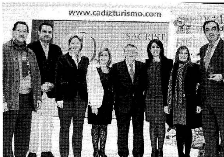
Un momento del acto de presentación de Sanlúcar en Fitur.

En un acto celebrado en el expositor del Patronato Provincial de Turismo intervinieron, además de