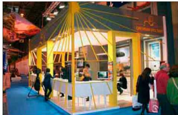
Stand de Oropesa en el pabellón 5 de Fitur 2011.