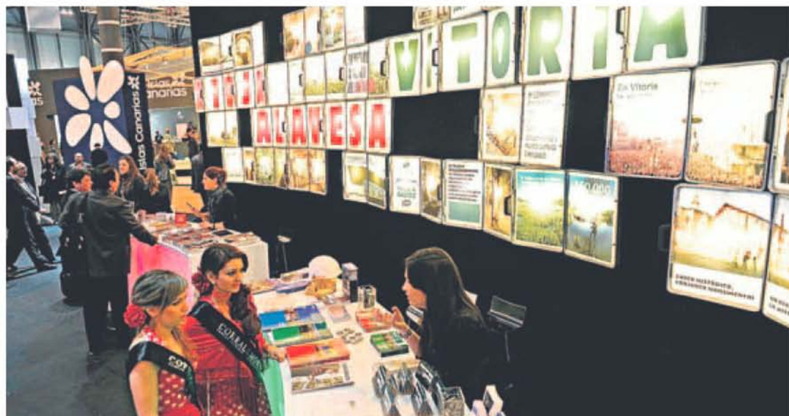
Vitoria comparte con la Rioja Alavesa un 'stand' donde se puede encontrar información sobre cualquier rincón de la ciudad.

La capital alavesa presume de «verde y patrimonio» en Fitur, donde firmas chinas se han interesado por su oferta turística