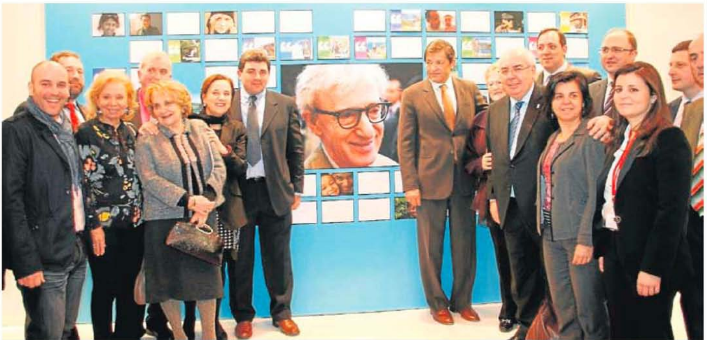
Foto de familia, ayer en Fitur, de la delegación asturiana con motivo del Día del Principado en la feria de turismo.