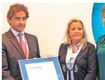
Francesc Colomer, alcalde de Benicàssim