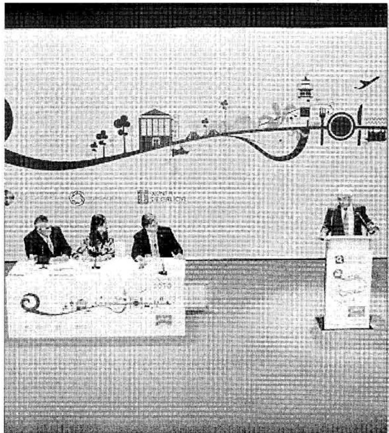
Acto de entrega dos diplomas de Calidade Turística.

Dentro das actuacións xerais máis destacadas, a secretaria xeral para o Turismo menciona o chamado Plan de Calidade Turística, lanzado desde Turgalicia, e sostido coa sinatura de convenios coas asociacións do sector por case 300.000 euros; a Campaña "Q" de Calidade Turística de Galicia desenvolvida en 2010 en medios profesionais e urbanos das grandes cidades gallegas, as liñas de axuda da Secretaría Xeral para reconvertir a planta hoteleira, baixo a filosofía de potenciar a cantidade versus calidade. ■