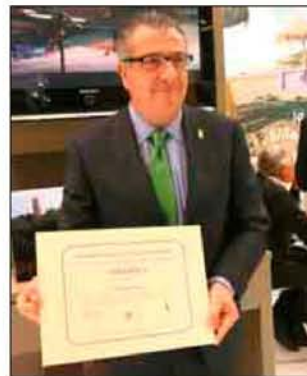
El alcalde muestra la 'Q' de Calidad.