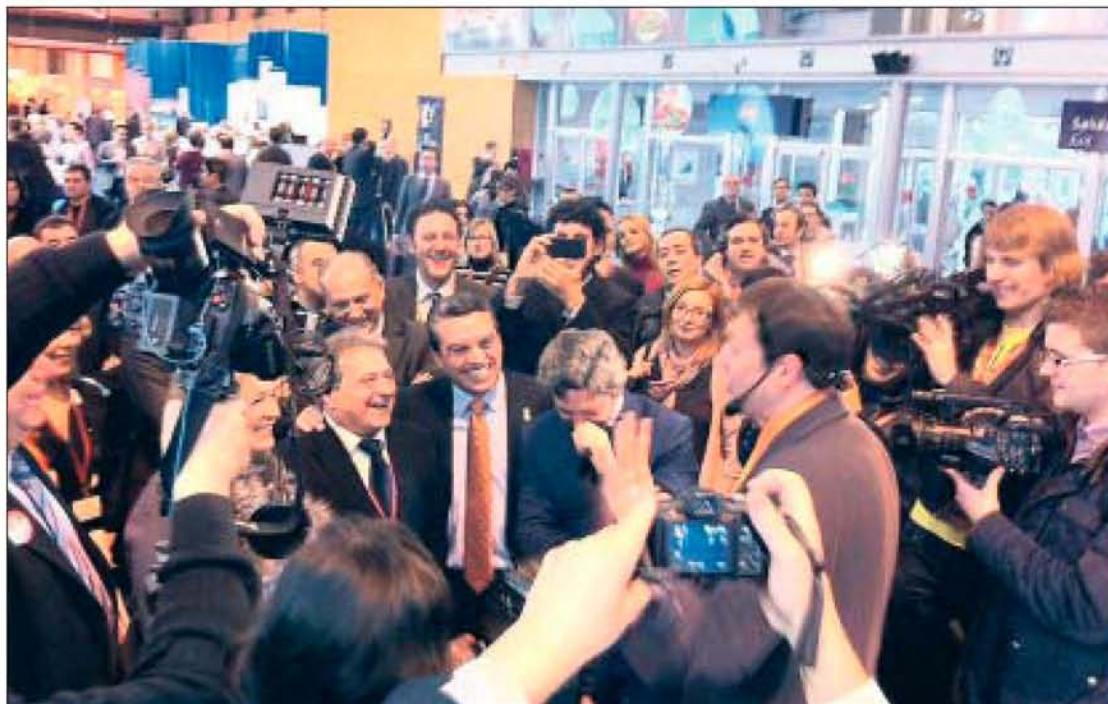
Rus y Sanjuán sonríen tras uno de los trucos del mago en medio de una gran expectación.