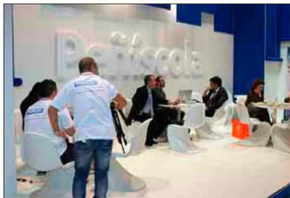
Han aprovechado para cerrar acuerdos con turoperadores.