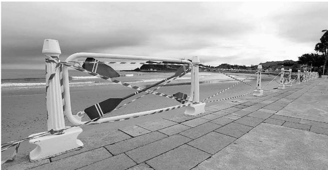
Las barandillas fueron arrancadas por la marea en noviembre y siguen 'protegidas' por cinta de seguridad a lo largo del paseo.