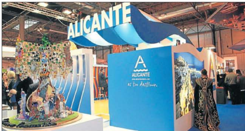
Imagen del stand de la ciudad en Fitur, donde se anunció que estaría la pitonisa.