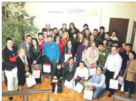
Visitantes en la factoría de Toledo.

pantes del programa «Testigos de Calidad» completan su estancia en la factoría de Toledo con la visita al interior de la cocina de uno de los restaurantes McDonald's, ini-