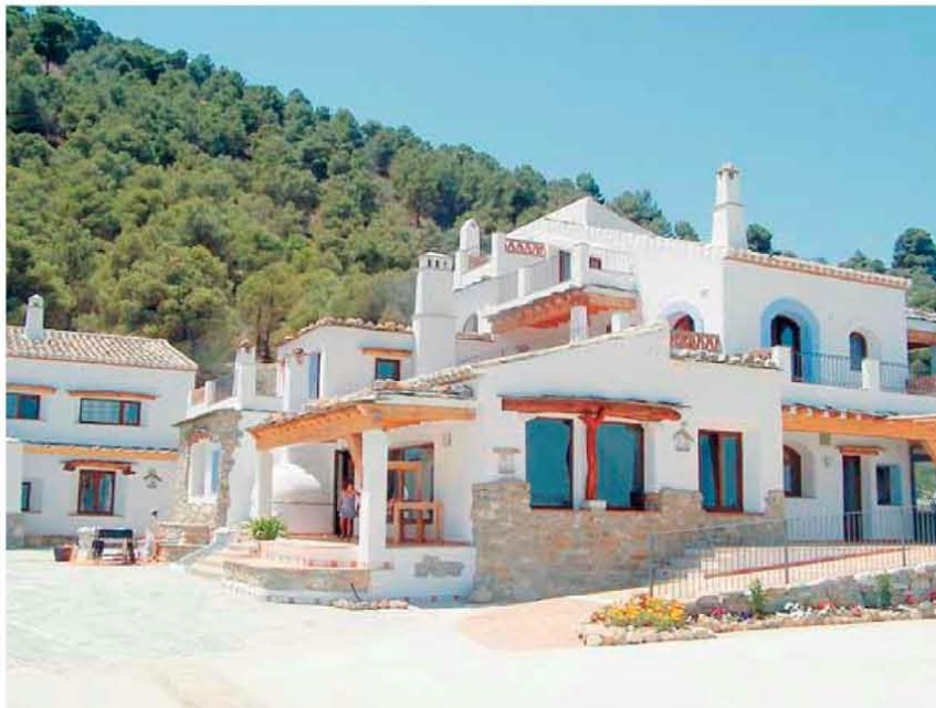
Imagen externa del edificio central del complejo turístico ecológico.