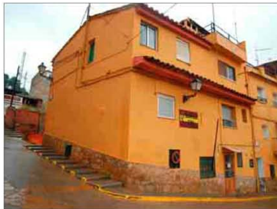
El cuartel de Montanejos, uno de los que espera una reforma.

gilancia nocturna el Ayuntamiento de Vilafranca ha constituido una Junta Local de Seguridad, en la que se coordina la acción del municipio con la Guardia Civil y la Subdelegación del Gobierno. El alcalde ha destacado el nivel de colaboración con