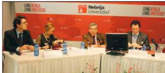
El director de Normalización del ICTE, junto a los demás ponentes en la jornada organizada por la Universidad Nebrija.

El director de Normalización del ICTE, apuntó que "para ser competitivos nuestras empresas implantan sistemas de calidad en sus organizaciones a través del cumplimiento de las normas publicadas, que tienden especialmente a gestionar los costes, apostar por la formación