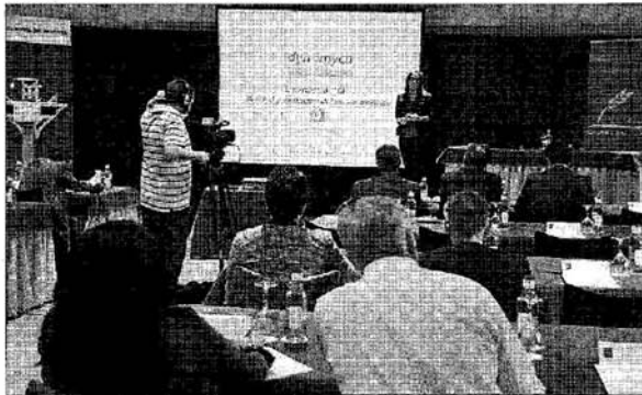
Un momento de las jornadas que se inauguraron ayer en San Ildefonso.