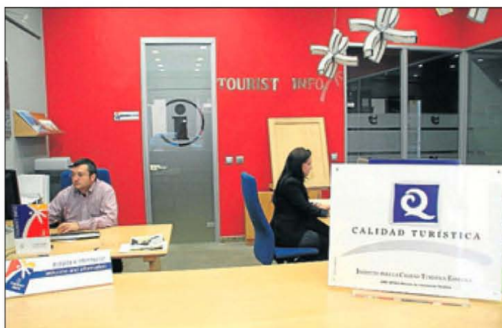
La certificación del Instituto de la Calidad Turística. JESÚS CRUCES