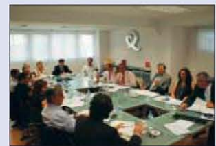
Junta Directiva del ICTE.

Confederación Española de Hoteles (CEHAT); Asociación Empresarial de Agencias de Viaje Españolas (AEDAVE); Asociación de Mayoristas de Viajes Españolas (AMAVE); Federación Española de Asociaciones de Agencias de Viajes (FEAAV); Federación Española de Hostelería (FEHR); Federación Española de Empresarios de Camping y Ciudades Vacaciones (FECCYV); Asociación para la Calidad del Turismo Rural (ACTR); Asociación Turística de Estaciones de Esquí y Montaña (ATUEM); RDO Spain; Europarc España; Federación Española Empresarial de Transportes de Viajeros (ASINTRA); Asociación Nacional de