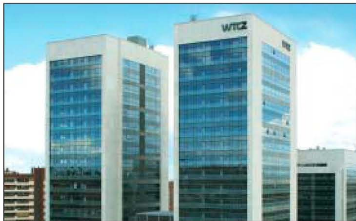
El World Trade Center de Zaragoza dispone de espacios de reuniones.

Finalmente, la oficina congresual ha apuntado que dentro de los objetivos marcados para este año se encuentra mantener el Sistema de Calidad implantado, mediante la mejora continua para revalidar la certificación de la 'Q' de calidad y la forma UNE-EN ISO 9001:2000.