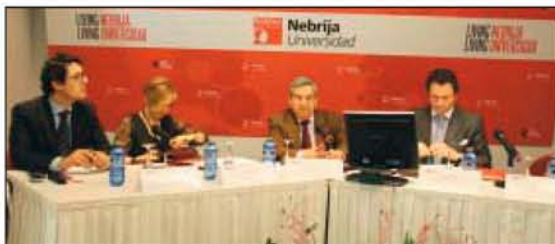
El director de Normalización del ICTE, junto a los demás ponentes en la jornada organizada por la Universidad Nebrija.

El director de Normalización del ICTE, apuntó que "para ser competitivos nuestras empresas implantan sistemas de calidad en sus organizaciones a través del cumplimiento de las normas publicadas, que tienden especialmente a gestionar los costes, apostar por la formación del personal y rentabilizar