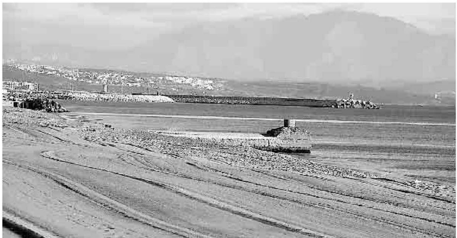
Los andalucistas hacen públicas sus propuestas sobre la conservación del litoral linense, en la imagen el de Levante.

Los andalucistas están remitiendo a la prensa en estos días diversas propuestas de su programa.