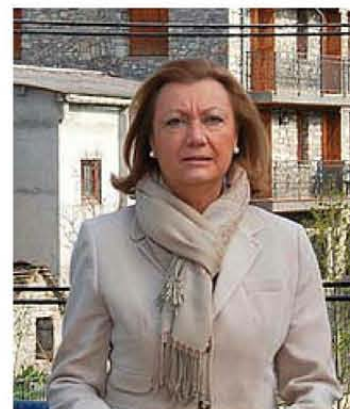
Luisa Fernanda Rudi, candidata del PP en Aragón, visitando Broto.