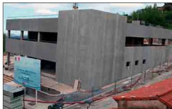
Balneario de Benassal, una de las esperanzas del futuro en el interior.

en estas fechas está en la Todolella, donde dos casas con auditoria Q de calidad, conseguida por las excelentes condiciones que reúnen, se han quedado vacías, como indicaba Calvo.