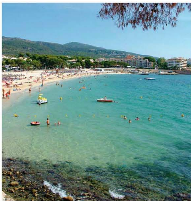
Las playas de Calvià son las más distinguidas por su calidad de la Unión Europea.

meses "se ha puesto de manifiesto que la ocupación este verano será bastante buena". Por todo ello, la institución trabaja para potenciar productos turísticos dirigidos a los principales segmentos, el principal, el familiar.