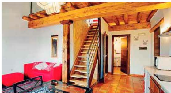
Interior de uno de los apartamentos.

Por otro lado, la Posada ha hecho pública su oferta de campamentos de verano a celebrar en el mes de julio en los que se llevarán a cabo jornadas de naturaleza, senderos, talleres de idiomas, vivac, juegos de agua, taller de arte, etcétera. Un total de 24 plazas para niños comprendidos entre 8 a 13 años.