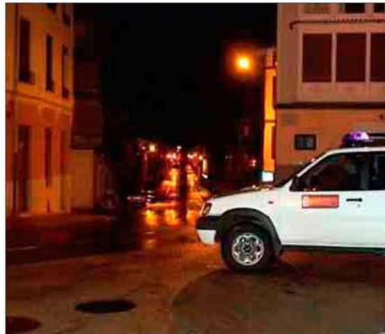
Una patrulla nocturna de Vilafranca, la pasada noche.

Cabe recordar que además de la puesta en marcha del servicio de vi-