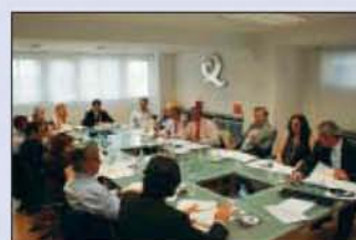
Junta Directiva del ICTE.

Confederación Española de Hoteles (CEHAT); Asociación Empresarial de Agencias de Viajes Españolas (AEDAVE); Asociación de Mayoristas de Viajes Españolas (AMAVE); Federación Española de Asociaciones de Agencias de Viajes (FEAAV); Federación Española de Hostelería (FEHR); Federación Española de Empresarios de Camping y Ciudades Vacaciones (FECCV); Asociación para la Calidad del Turismo Rural (ACTR); Asociación Turística de Estaciones de Esquí y Montaña (ATUEM); RDO Spain; Europarc España; Federación Española Empresarial de Transportes de Viajeros (ASINTRA); Asociación Nacional de Bañerías (ANBAL); Real Federación Española de Golf, (RFEG);